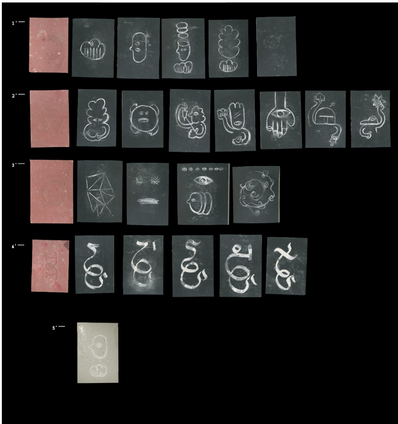
fig.2. Prototype de jeu utilisé pour les entretiens. Les cartes sont constituées de 3 couches : un papier recyclé par mes soins de couleur rouge, avec un filigrane embossé avec une plaque de zinc gravée et un signe gaufré avec du rhodoïd découpé ; un carton mécanique au centre, une feuille de papier teinté dans la masse noir. Les figures sont dessinées au pinceau avec du blanc de meudon. En bas un des prototypes réalisés directement sur carton mécanique.

Les questions/cartes quant à elles s'appuient sur différents cadres d'interprétations issus de l'observation : — les modes d'existences 14 chez Bruno Latour (fig.2.2) ; — les concepts de la psychanalyse institutionnelle systémique de Guattari (fig.2.3) comme le rhizome (réseau d'agencements et de détermination), la ritournelle (flux et force esthétique qui guident l'action), la visagéité (captation d'attention par des êtres), l'agencement (attachements d'êtres entre eux), le point gris/trou noir, etc. ; — puis une suite de catégories mythologiques de récits personnels et éthiques dont j'ai obtenu une typologie avec les observations de ma thèse (fig.2.4) : épistémologie (comment les choses sont perçues), anthropologie (quel genre de relation humaine est impliquée), socius (d'où parle l'acteur), ontologie (quels rapports aux matériaux et à la production), idéologie (quelles idées sont mobilisées), sémiologie (quels sens sont exprimés et par quelles formes). Ici