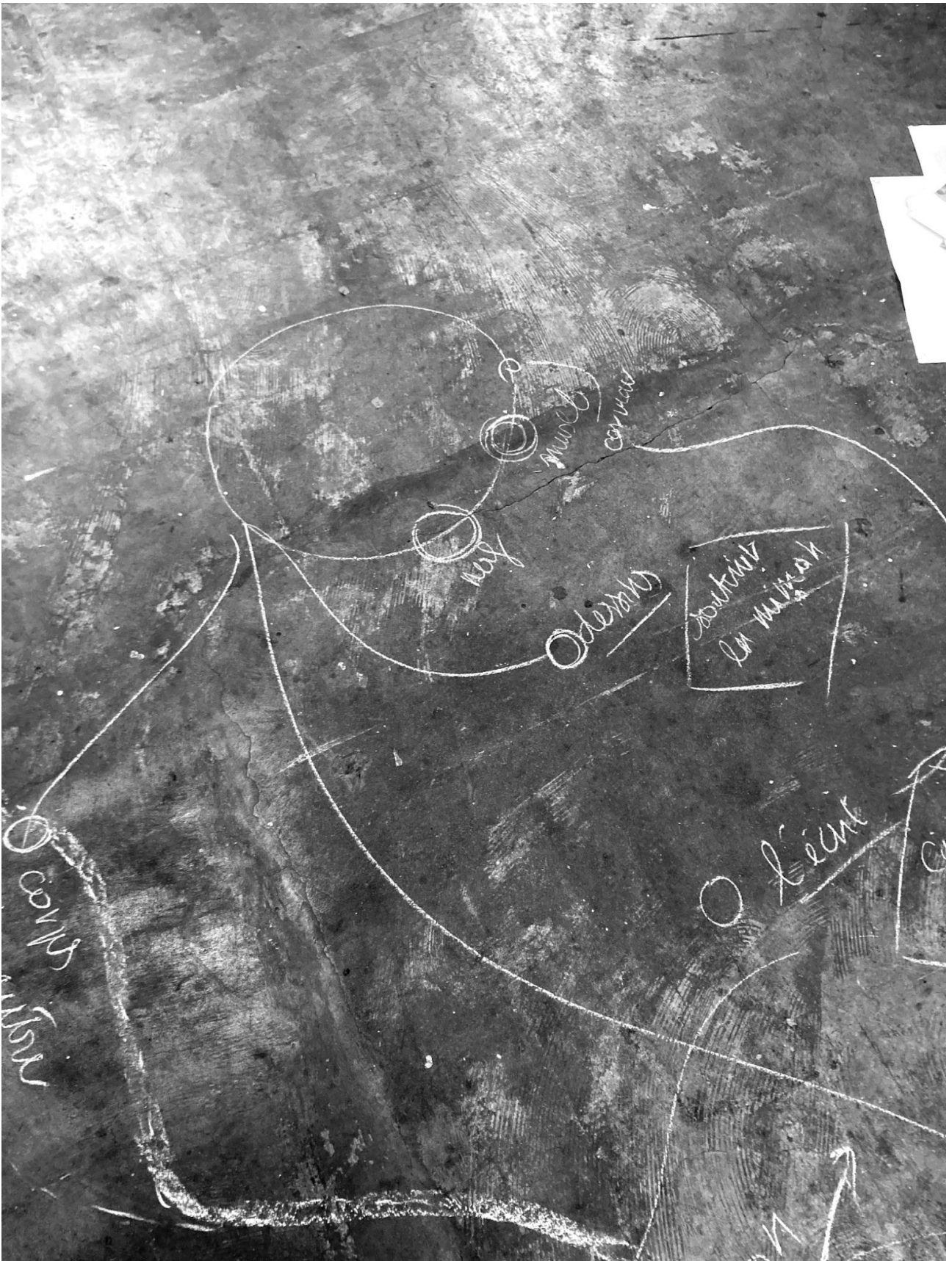
fig.3. Cartographie des acteurs et actants documentaires décrites en temps réel par une résidente des chaudronneries et tracée autour d'elle à même le sol par mes soins.