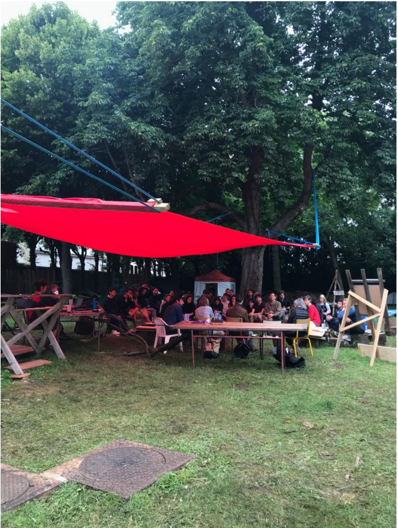
Figure 2. L'auditorium de l'Université d'été de la Preuve par 7, Marie Tesson