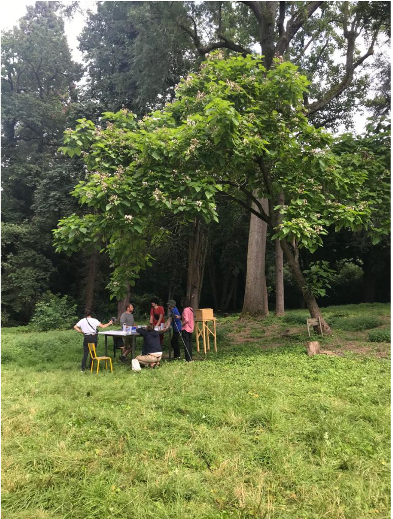
Figure 3. La table d'observation / Bellastock 2021 + Université d'été de la Preuve par 7, Marie Tesson