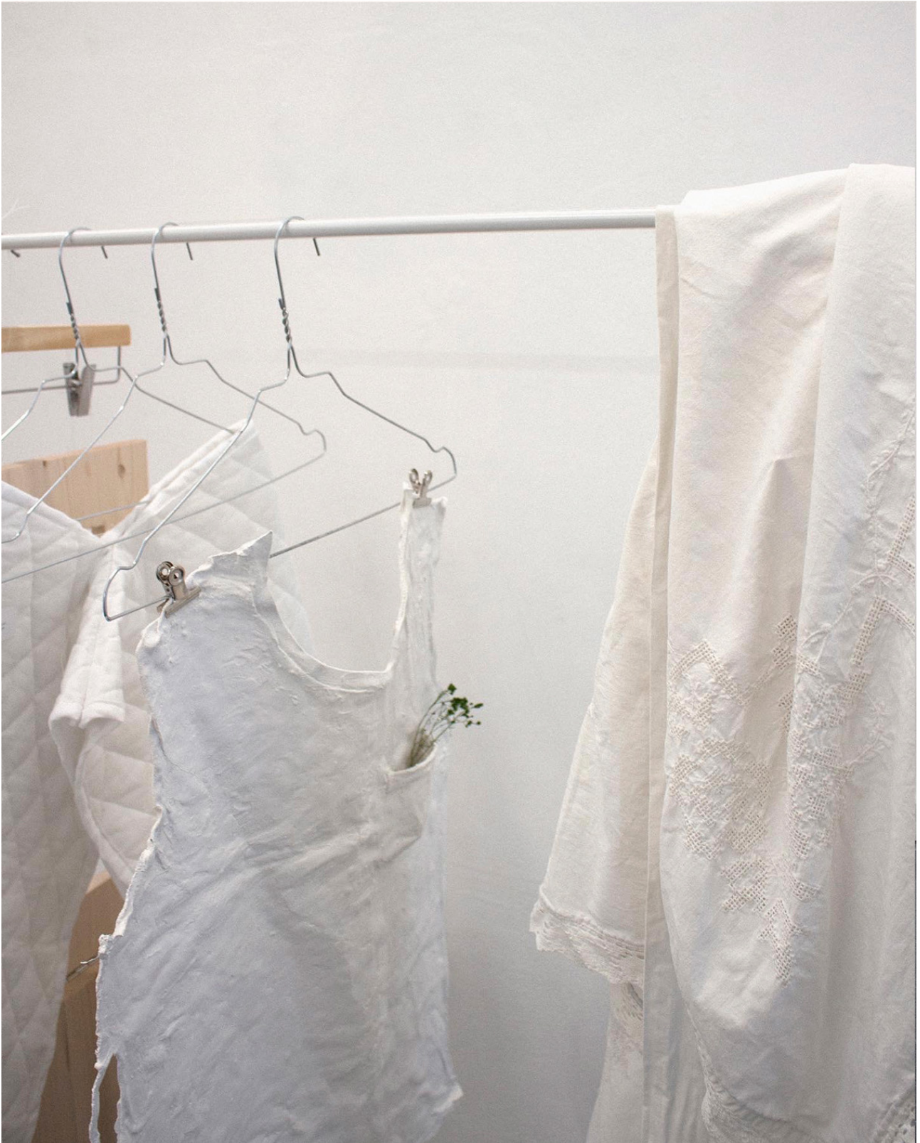
Figure 4. Ninon Leal, Bauen II. Réouvrir. Objet vestimentaire 1.