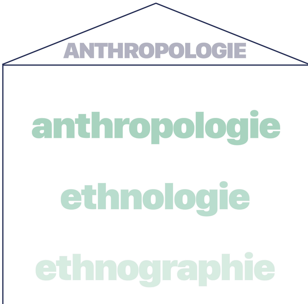
Figure 2. Schéma de la maison anthropologique de Claude Lévi-Strauss, Camille Mançon.