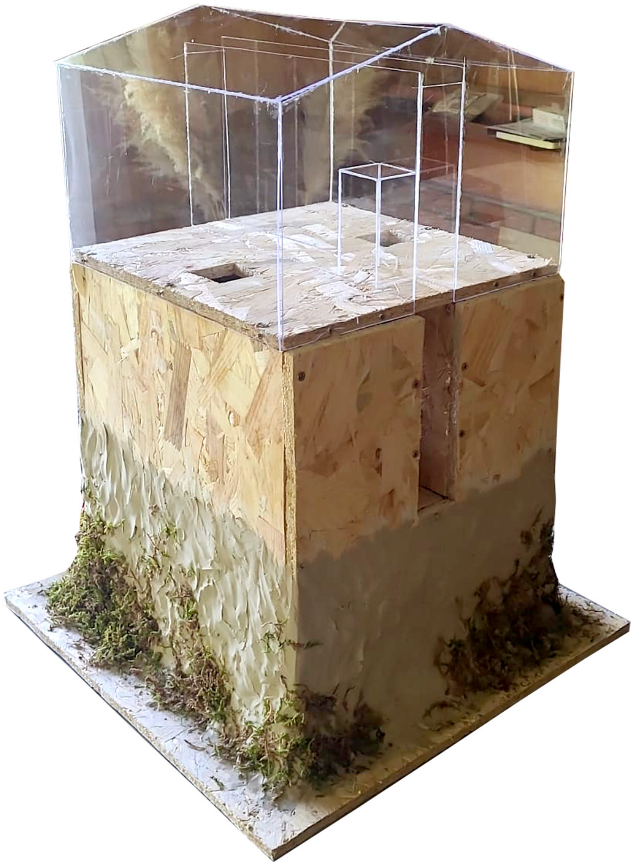
Figure 3. Maquette sensible de la maison du design et de l'anthropologie , Camille Mançon.