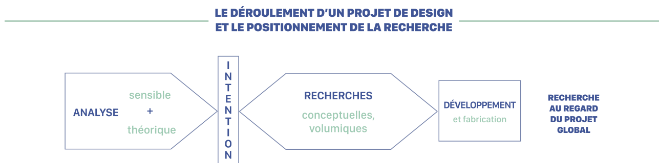
Figure 1. Schéma du processus de projet en design, Camille Mançon.

Afin de détailler la structure et les méthodes du projet de design, nous nous appuyerons sur la définition opératoire du champ établie par la philosophe et théoricienne du design Catherine Chomarat-Ruiz dans son ouvrage À l'écoute du design, une théorie critique 5 . Inspirée de la notion d'habitabilité de Alain Findeli 6 , elle se présente comme suit : « Le design est une pratique de projet dont la finalité est l'amélioration de l'habitabilité du monde dans le respect des humains et des non-humains 7 . » Le design est donc ici compris comme une pratique mettant au centre de ses considérations l'inclusion sociale mais également environnementale, sans distinction.