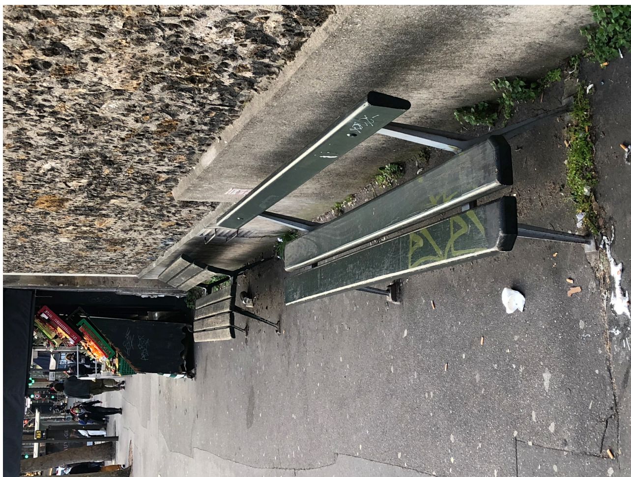
Figure 6. Deux bancs publics au design différent dans le 19 e arrondissement de Paris.

Cette dame m'expliquait que, depuis quelque temps, les bancs proposés dans l'espace public de Paris – en très grande majorité des bancs Davioud – ne sont plus adaptés ni à sa morphologie à cause de son âge ni aux usages qu'elle aimerait dorénavant en faire, qui ne sont plus exactement les mêmes qu'il y a 1, 3, 5 ou 10 ans. Cette dame me disait qu'elle aime sortir seule se balader, ce qui pour elle est un moyen important de garder une certaine liberté, mais surtout la preuve réelle de son autonomie : cependant son âge l'oblige à faire dorénavant des pauses régulières. Or, me disait-elle, il y a de moins en moins de bancs à Paris, l'obligeant à parcourir de plus grandes distances entre deux possibilités d'arrêts. Mais surtout la posture du corps, très droite, dictée par la forme des bancs et leur hauteur par rapport au sol l'empêchent d'en faire usage : elle m'a alors confié, très peinée, qu'elle préférerait continuer son chemin, et peiner, plutôt que de s'asseoir un instant, voire encore plus grave, ne pas sortir de chez elle, car elle savait déjà que cette sortie pourrait être compliquée. Ce qui m'a semblé important dans ce qu'elle me racontait, c'est qu'elle anticipe les difficultés d'accessibilité à la rue et à l'espace public, la peur liée à cela lui interdit parfois de sortir de chez elle.