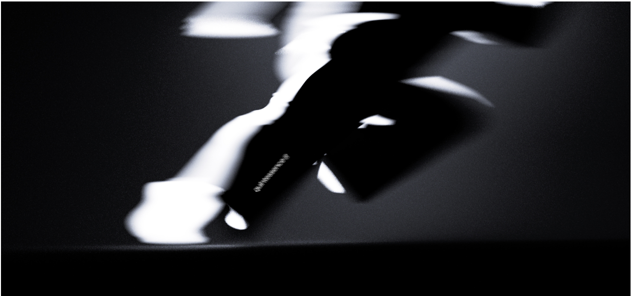
Manon Flacher, Quintessence® Silent performance , 2025, CGI, Annecy