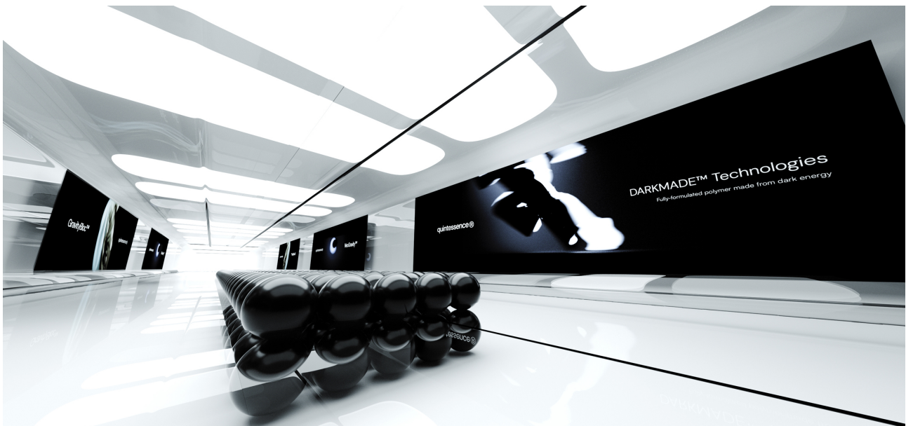
Manon Flacher, Quintessence® Headquarters , 2025, CGI, Annecy