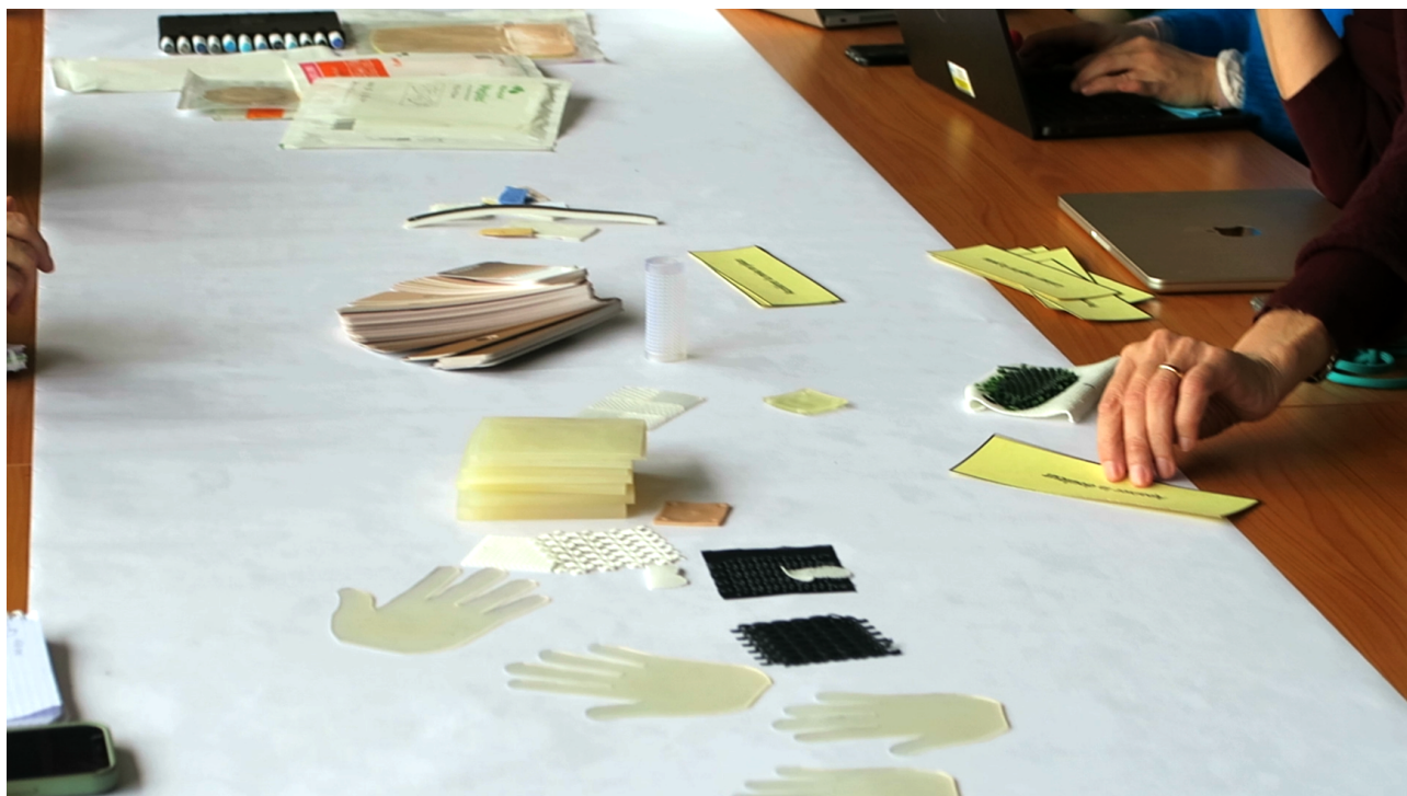
Figure 2. Utilisation d'un jeu de cartes pour définir les matériaux du dispositif médical Peaux Éthiques lors d'un atelier d'idéation au centre de référence MAGEC, Hôpital Necker

dispositifs médicaux. Au-delà des impératifs de sécurité et d'efficacité thérapeutique, ceux-ci devront intégrer des critères sensoriels et esthétiques répondant aux différentes fonctions du Moi-Peau : la contenance et la protection, en privilégiant des matériaux doux, respirants et non-irritants, mais aussi les fonctions de communication et d'individuation, en proposant des choix de couleurs, de motifs ou de textures permettant une personnalisation.