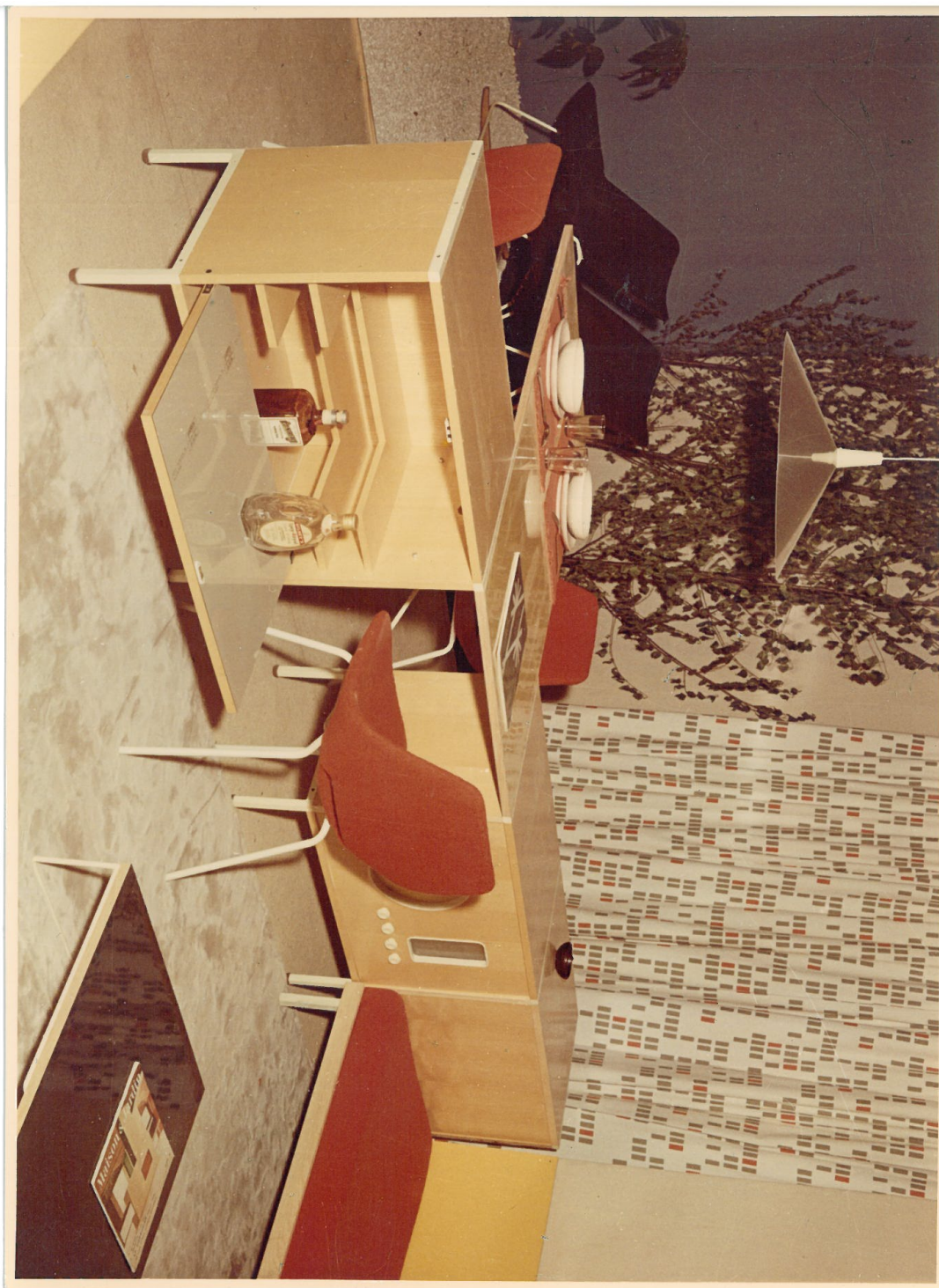
Concours Formica, conçu en 1956 par l'ARP. Fonds d'archives Pierre Guariche.

La table établit un décrochement dans le plan rectangulaire composé par les caissons en bois clair de chez Minvielle. Les repas se prennent soit en tête-à-tête, soit à quatre le tout éclairé par le plafonnier 3077 de l'ARP, édité par Pierre Disderot. Des chaises rouges Amsterdam de Steiner accompagnent les fauteuils G1 de chez Airborne, dessinés par Pierre Guariche. Deux banquettes juxtaposées disposent également d'un élément qui consiste en un décor mural en Formica jaune fixé au-dessus des coussins rouges qui tranchent avec les rideaux Gratte-ciel de Jacqueline Iribe. Pour achever ce concept novateur, il dispose un fauteuil Corb A7 , face à une table de Pierre