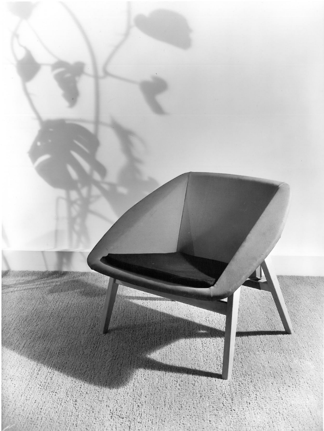
Fauteuil Corb, conçu en 1955 par l'ARP, édité par Steiner.

Pour continuer leur ascension sur le marché du meuble moderne, l'ARP met en place une stratégie de communication qui use de divers outils afin de se faire connaître auprès des consommateurs. En 1955, il s'expose à travers la mise en scène de trois stands différents lors du 24 e SAM au Grand Palais. Le SAM, que visitent désormais professionnels et grand public, devient un haut lieu de la consommation 16 grâce à la diffusion du prêt. Cet espace d'exposition commerciale se donne plutôt un rôle d'éducation en orientant l'investissement des ménages vers