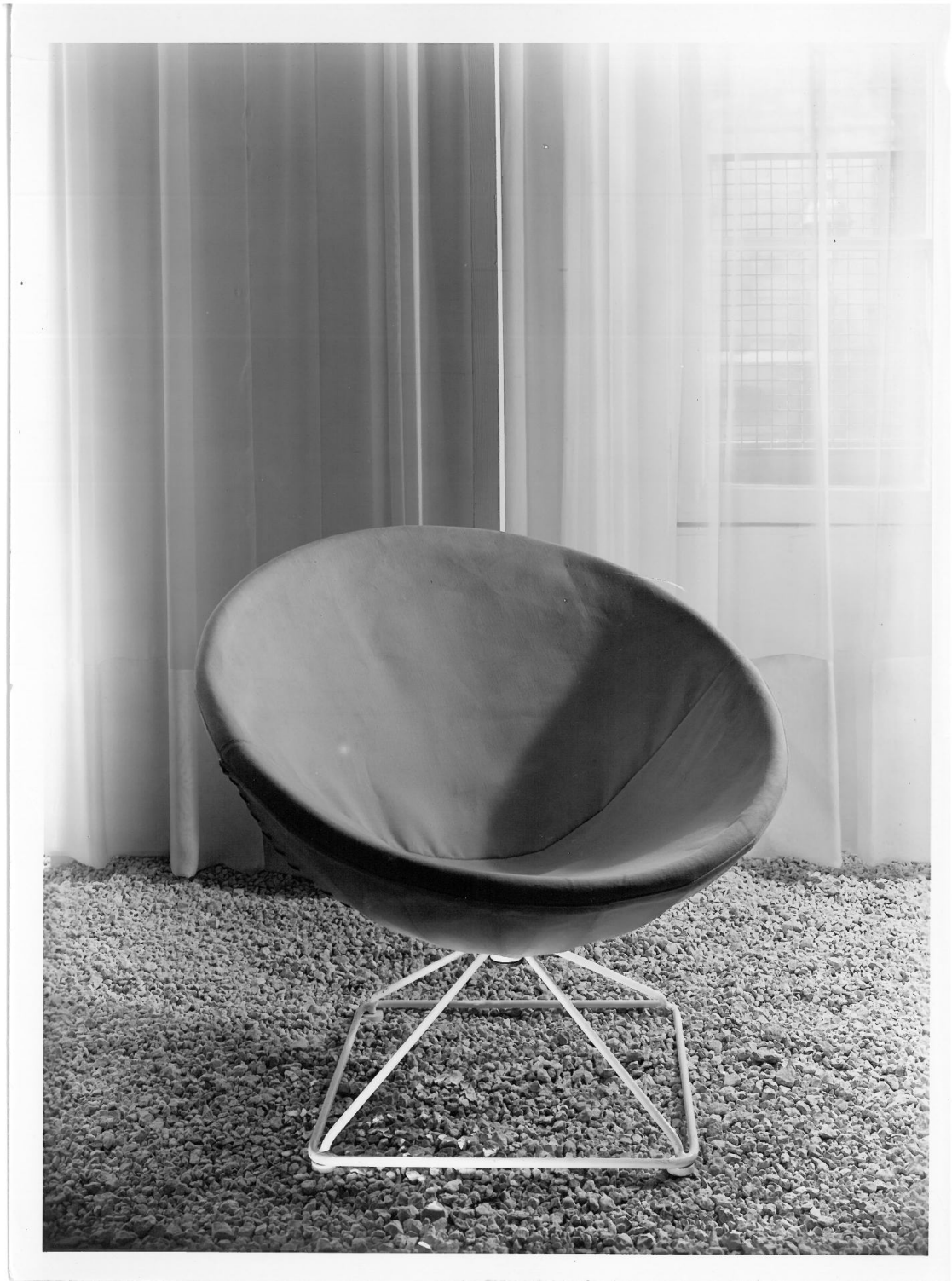
Fauteuil Radar, conçu en 1955 par l'ARP édité par Airborne. Fonds d'archives Pierre Guariche

Dans ce projet, les meubles de l'ARP, placard, table, sont plurifonctionnels par l'introduction de technologies liées à l'électricité. Sans doute, Pierre Guariche contribue en grande partie à la réalisation de ses éléments au vu de son cursus à l'école Breguet où il a commencé des études d'ingénieur spécialisées dans les applications de l'électricité. Pour ce dernier, la télévision doit s'intégrer dans l'espace du salon, car ce nouvel outil de communication requiert un bon nombre de paramètres à mettre en œuvre pour optimiser son utilisation. Il met ses connaissances