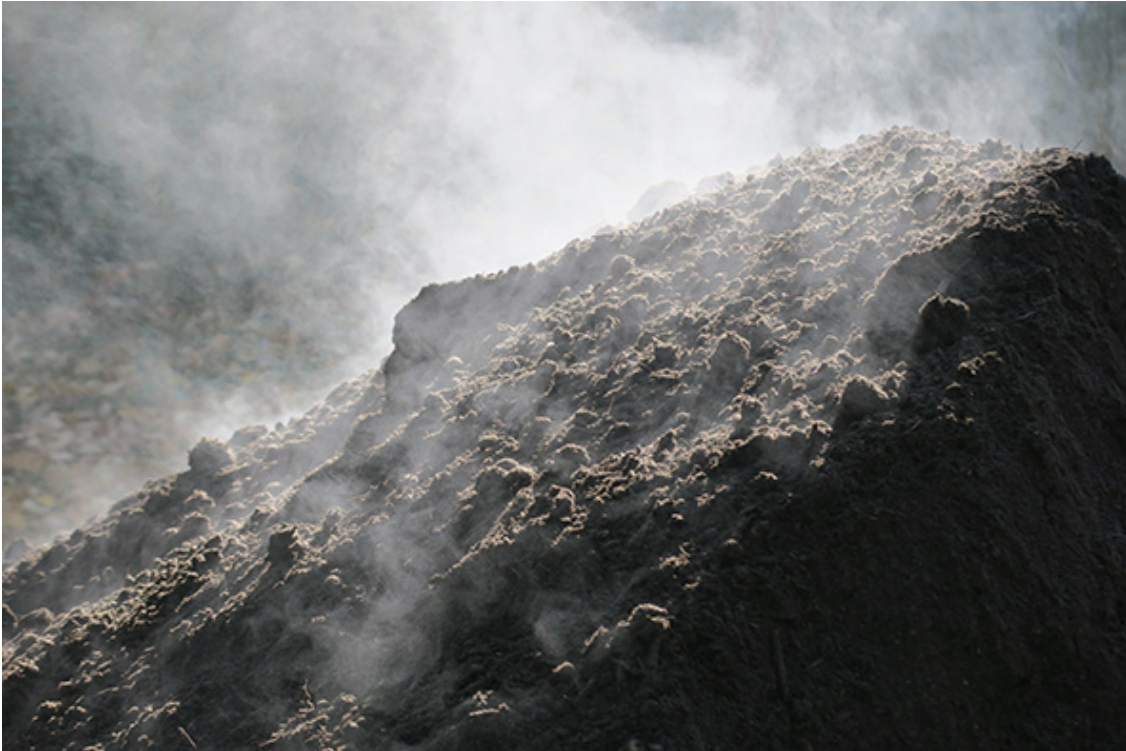
Figure 4 . Vapeur de terre après dépôt au jardin de la HEAR, 2022.

« C'est le matin, il est 8h... 35. Il y a une petite gelée sur l'herbe, puisqu'il fait très froid à ce moment-là, on est au mois d'octobre. On n'a même pas pris nos manteaux. Je sens que chaque petit brin d'herbe a des petites gouttes gelées. [...] [L'herbe] n'est pas moelleuse comme d'habitude. Dès que je marche, ça craque. [...]