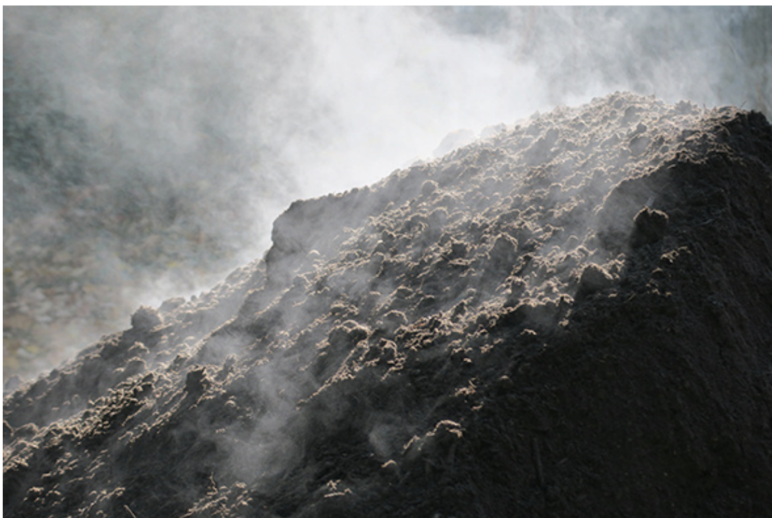
Figure 4 . Vapeur de terre après dépôt au jardin de la HEAR, 2022.

« C'est le matin, il est 8h... 35. Il y a une petite gelée sur l'herbe, puisqu'il fait très froid à ce moment-là, on est au mois d'octobre. On n'a même pas pris nos manteaux. Je sens que chaque petit brin d'herbe a des petites gouttes gelées. [...] [L'herbe] n'est pas moelleuse comme d'habitude. Dès que je marche, ça craque. [...]