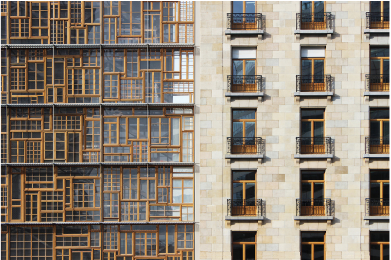
Fig. 6 : Détail de la façade d'Europa, Bruxelles (Belgique), 2015, projet conçu par Philippe Samyn & Partners avec l'aide d'un brocanteur, © Philippe Samyn and Partners architects & engineers, Lead and Design Partner with Studio Valle Progettazioni architects, Buro Happold Limited engineers, photo : Quentin Olbrechts.