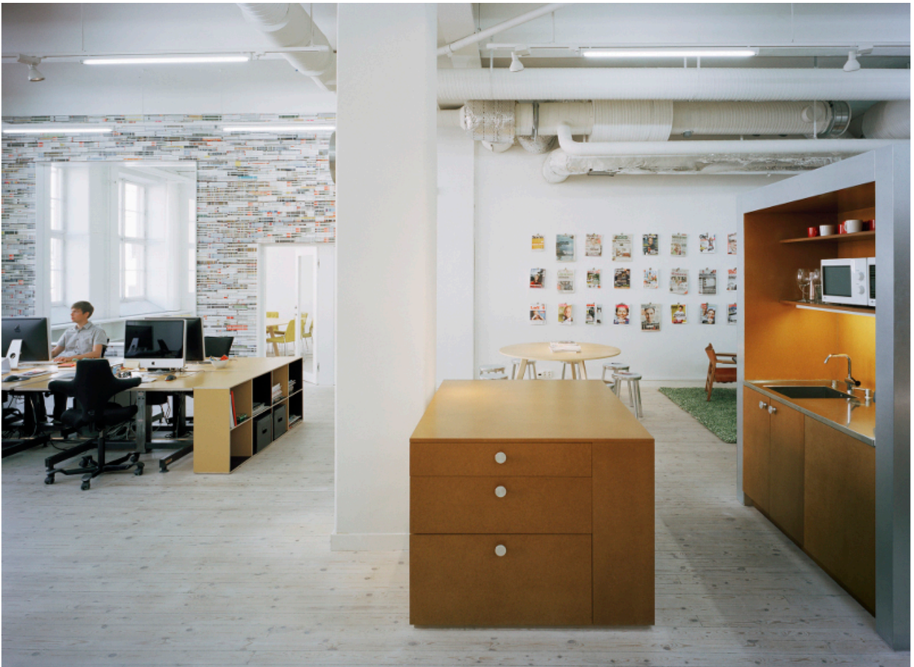
Fig. 7 : Bureaux d'Oktavilla, Stockholm (Suède), 2009, projet conçu par Elding Oscarson, © Åke E:son Lindman.

Les bureaux de Oktavilla, réhabilités par l'agence suédoise Elding Oscarson à Stockholm, sont conçus par soustraction puis addition de matériaux. Dans un ancien atelier textile dépouillé, les architectes ont restructuré les espaces par des parois de contreplaqué percées de cadres débordants accueillant de larges ouvertures. Au fil du temps, les hauts pans verticaux ont été recouverts de magazines empilés au fur et à mesure. Les piles de revues colorées dialoguent avec les percements et donnent une impression paradoxale à la fois temporaire et solide. Les qualités acoustiques du papier permettent de ne pas fermer les zones de travail en minimisant les interactions sonores. Le détournement de matériau offre une identité à l'agence, à partir de la démonstration de savoir-faire en graphisme : « les piles de magazines de récupération offrent un bon moyen de lancer la discussion pour le client, puisqu'il s'agit d'une agence de web design et conception de magazines 23 . »