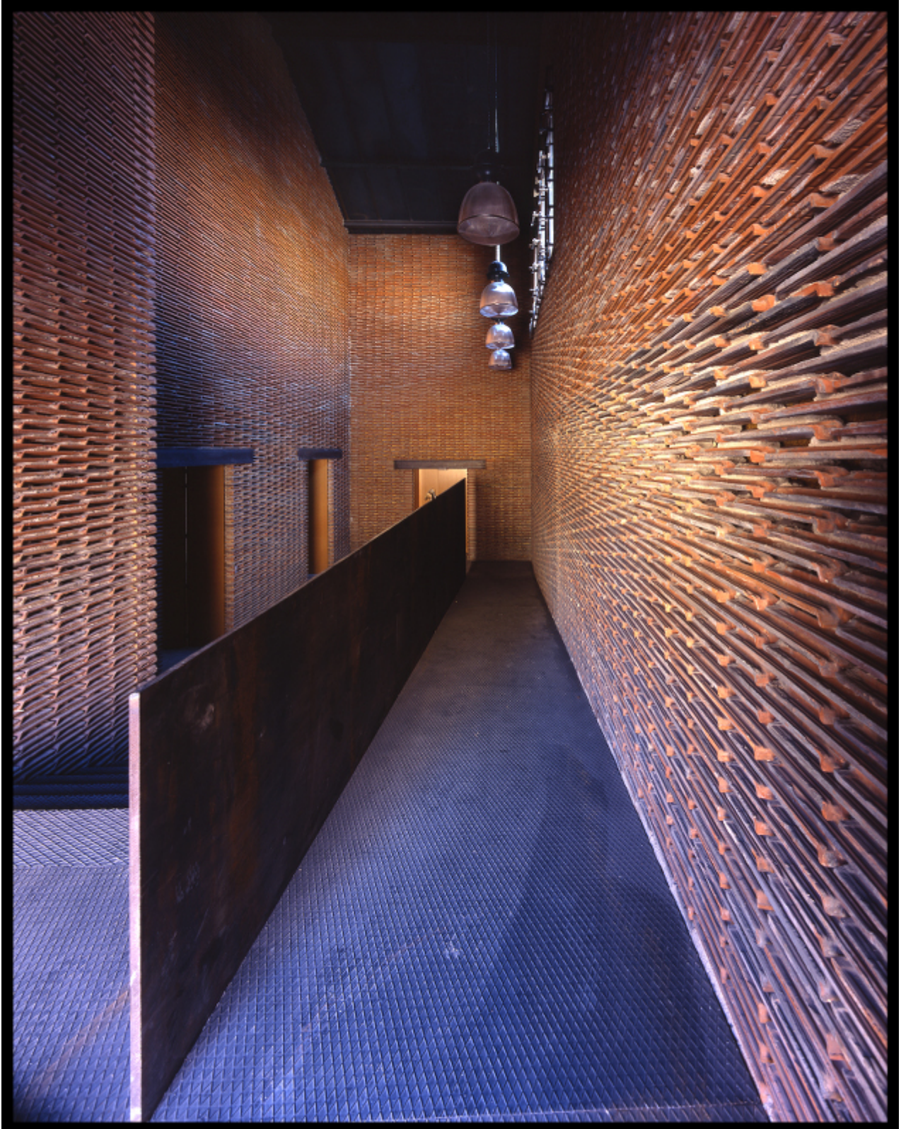
Fig. 3 : Abattoirs 8B transformés en bureaux, Madrid (Espagne), 2009, projet conçu par Arturo Franco avec la collaboration des ouvriers du chantier, © Carlos Piñar.