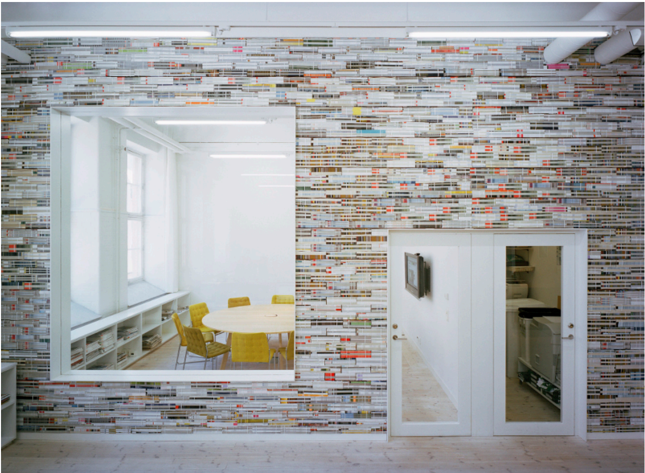
Fig. 8 : Détail des cloisons habillées de magazines d'Oktavilla, Stockholm (Suède), 2009, projet conçu par Elding Oscarson.