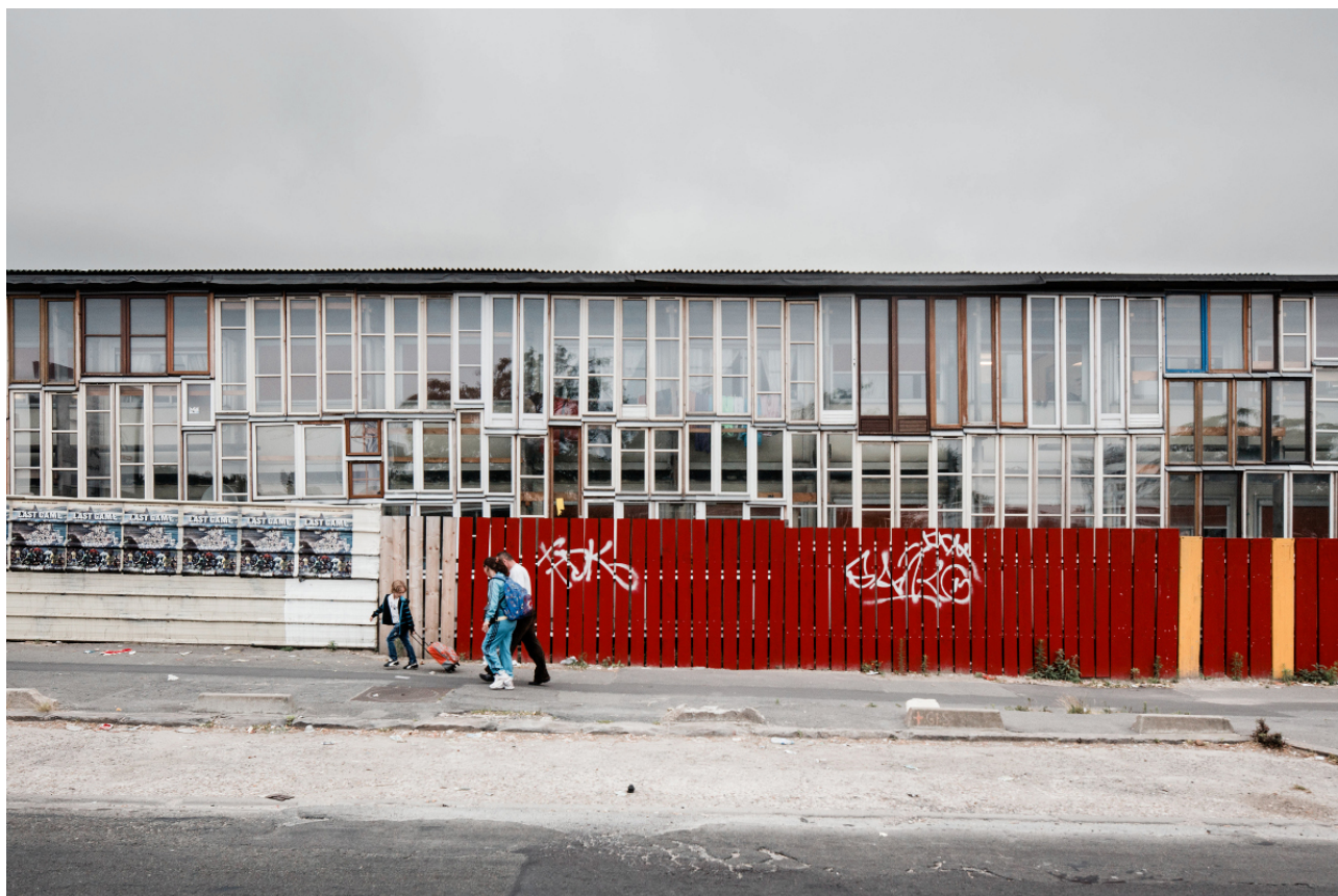
Fig. 1 : La passerelle, structure d'hébergement d'urgence, Saint-Denis (France), 2013, projet conçu et construit par Emmaüs Coup de Main, l'architecte Niclas Dünnebacke, les Bâisseurs d'Emmaüs, Architecture Sans Frontière, des travailleurs en contrat d'intégration et des immigrés volontaires, © Cyrus Cornut.

La structure d'hébergement d'urgence La passerelle, installée par Emmaüs Coup de Main en bordure du boulevard périphérique parisien, accueille des familles d'origine roumaine issues de campements voisins. Placée devant une architecture construite à partir d'anciens Algeco de chantier, une enveloppe vitrée isole les logements du bruit, créant un écran acoustique contre l'autoroute voisine. En collaboration avec des immigrés, des travailleurs en contrat social d'intégration et les Bâisseurs d'Emmaüs, elle a été construite avec des matériaux réemployés, de vieilles fenêtres et une toile de publicité du Centre Pompidou. « Étant donnée la disparité des matériaux collectés, les dessins de détails sont vite devenus inopérants. Il a fallu improviser 21 » explique l'architecte Niclas Dünnebacke. L'espace ménagé entre les Algeco et la nouvelle façade devient une serre permettant de multiples plantations dans un programme qui n'en compte généralement pas, car considéré comme une « architecture de survie ».