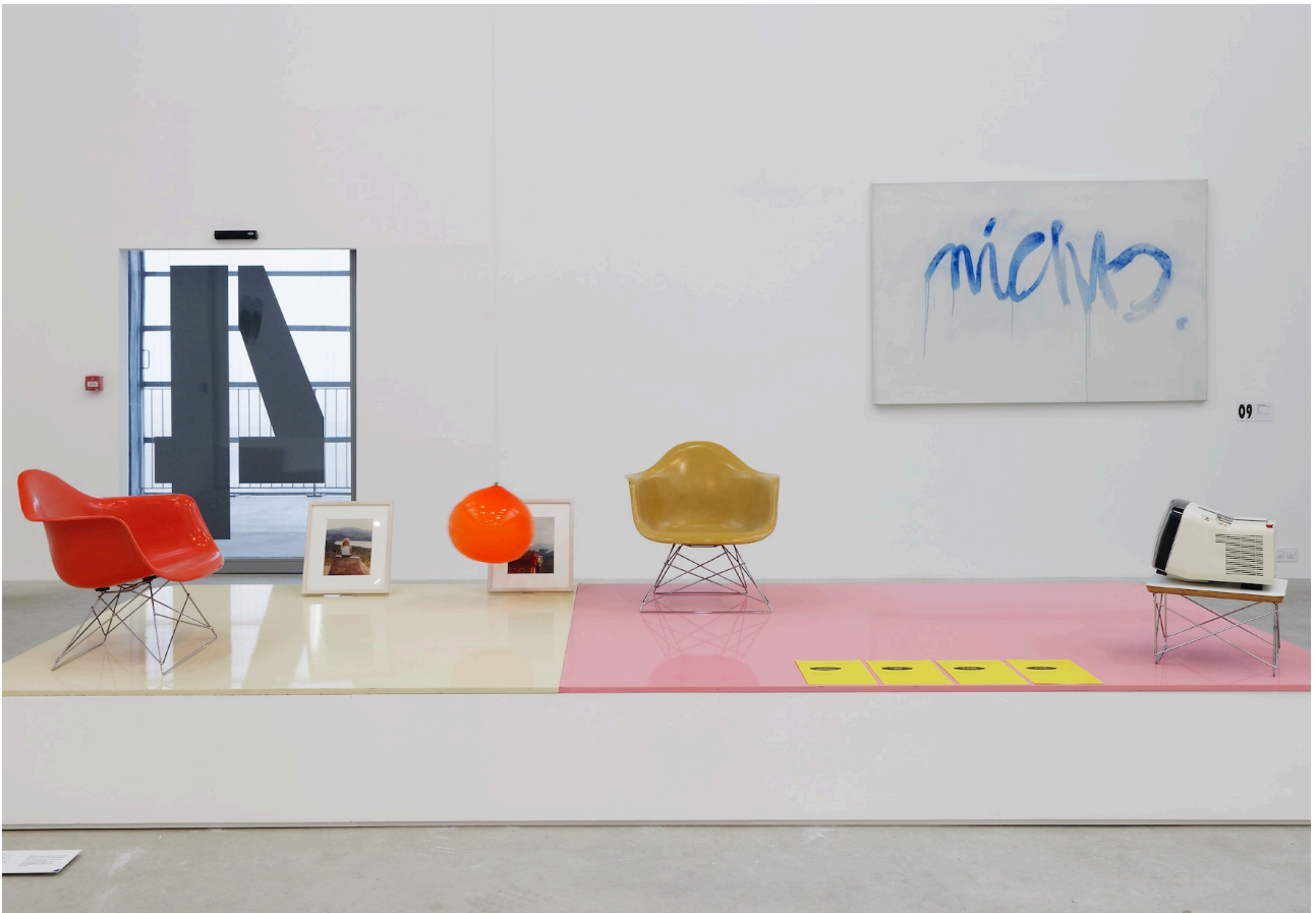
Figure 1. Vue de l'exposition « Les objets domestiquent », 2017, Frac Grand Large — Hauts-de-France, Dunkerque. Au premier plan : Dejanov et Heger, Still Life (Plenty Objects Of Desire), 1997. Au second plan : Bernd Lohaus, Nichts, 1979.