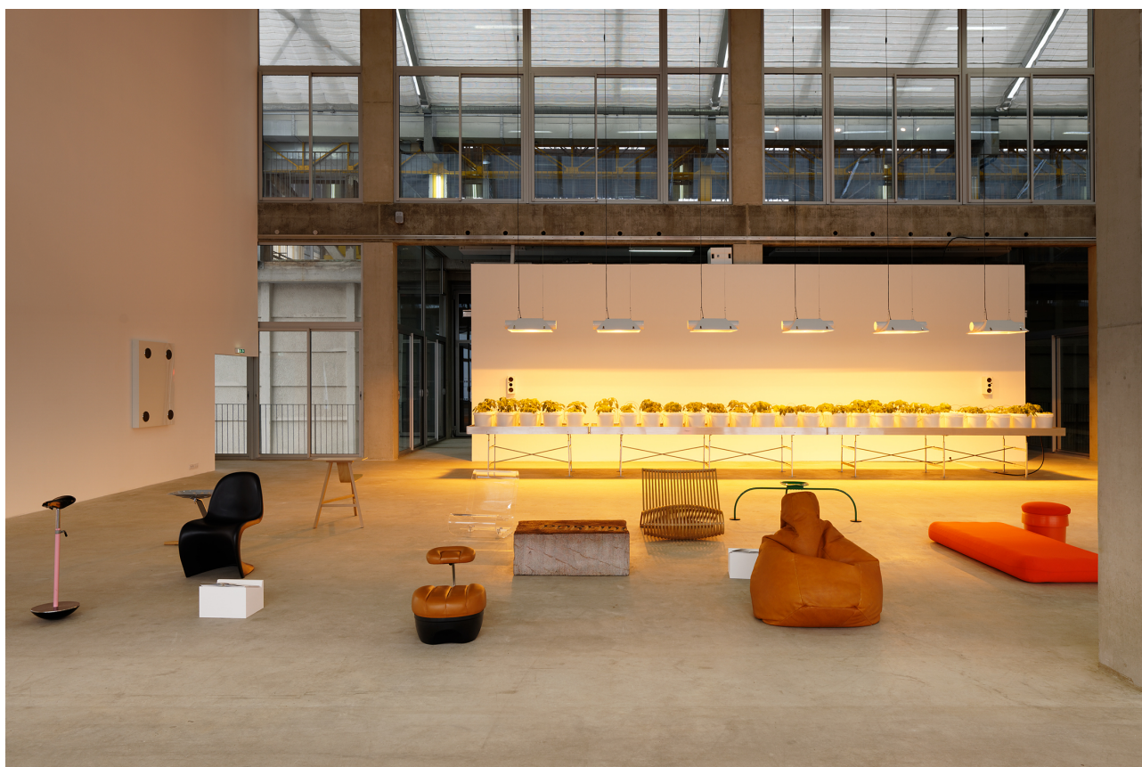
Figure 5. Vue de l'exposition « Tubologie — Nos vies dans les tubes », KVM — Ju Hyun Lee & Ludovic Burel, 2018, Frac Grand Large — Hauts-de-France, Dunkerque.

K. D. : Votre question est importante car elle interroge le travail d'archivage préalable à une historiographie des expositions. Cette fonction d'archivage est malheureusement souvent négligée par les Frac. La mobilité des collections nous désigne comme des acteurs de terrain. Or cette mobilité a permis d'expérimenter des approches curatoriales extrêmement variées dans leurs scénographies, leurs protocoles et l'implication des visiteurs. C'est un chantier qu'il nous appartient d'ouvrir pour affiner les réponses. Ma sélection s'est concentrée sur les expositions figurant uniquement des designers – comme « Vous aimez les objets » – et sur d'autres qui questionnaient les frontières disciplinaires. Il s'agissait ici de pointer des connivences conceptuelles, thématiques, historiques comme dans les expositions : « Trafic d'influences », « Tubologie - Nos vies dans les tubes » ou encore « GIGANTISME - ART & INDUSTRIE : Space is a House ». Je souhaite vivement que ce travail d'analyse historique puisse être engagé pour montrer comment le Frac Grand Large a été précurseur dans le décloisonnement de ces disciplines en travaillant des écarts laissant s'exprimer autant de scepticisme que d'enthousiasme.