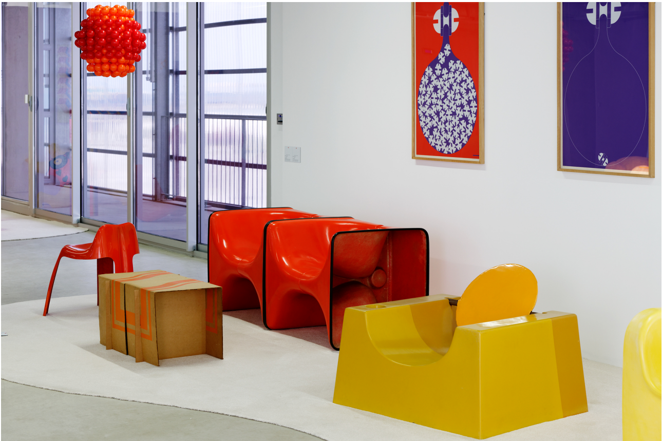
Figures 6 et 7. Vue de l'exposition « Space is a House » dans le cadre de GIGANTISME – ART & INDUSTRIE, 2019, Frac Grand Large – Hauts-de-France, Dunkerque