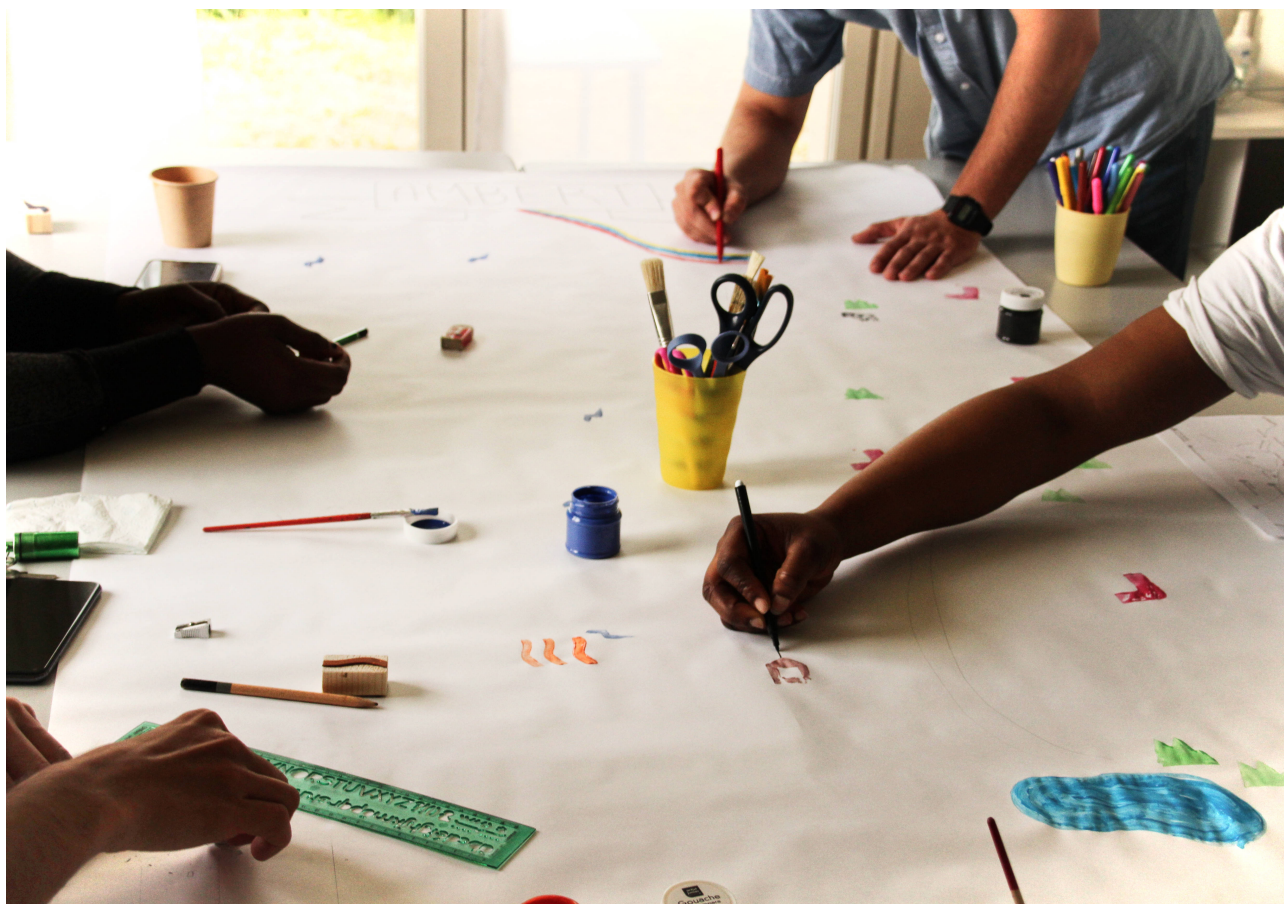
Figure 4. Atelier n°2, 2 juin 2021, Photographie Frédéric Lebert

Ma recherche-experimentation questionne les outils de narration et de connaissances actuels pour et sur les expériences migratoires, tout autant que la place et le rôle du designer dans le cadre d'une étude sociale et sociologique. Si ces cartes mais également le compte rendu de ces moments cartographiques permettent d'apporter des connaissances dans l'étude du phénomène migratoire, c'est également parce qu'il s'agit de considérer le design et la pratique collective et pluridisciplinaire comme des sources de connaissances et de savoirs 41 . Il s'agit alors de penser la porosité des domaines scientifiques en y incluant le design comme « une recherche systématique de connaissance et d'acquisition de connaissances en rapport avec l'écologie humaine généralisée envisagée du point de vue du mode de pensée propre au designer, c'est-à-dire dans une perspective orientée-projet 42 ».