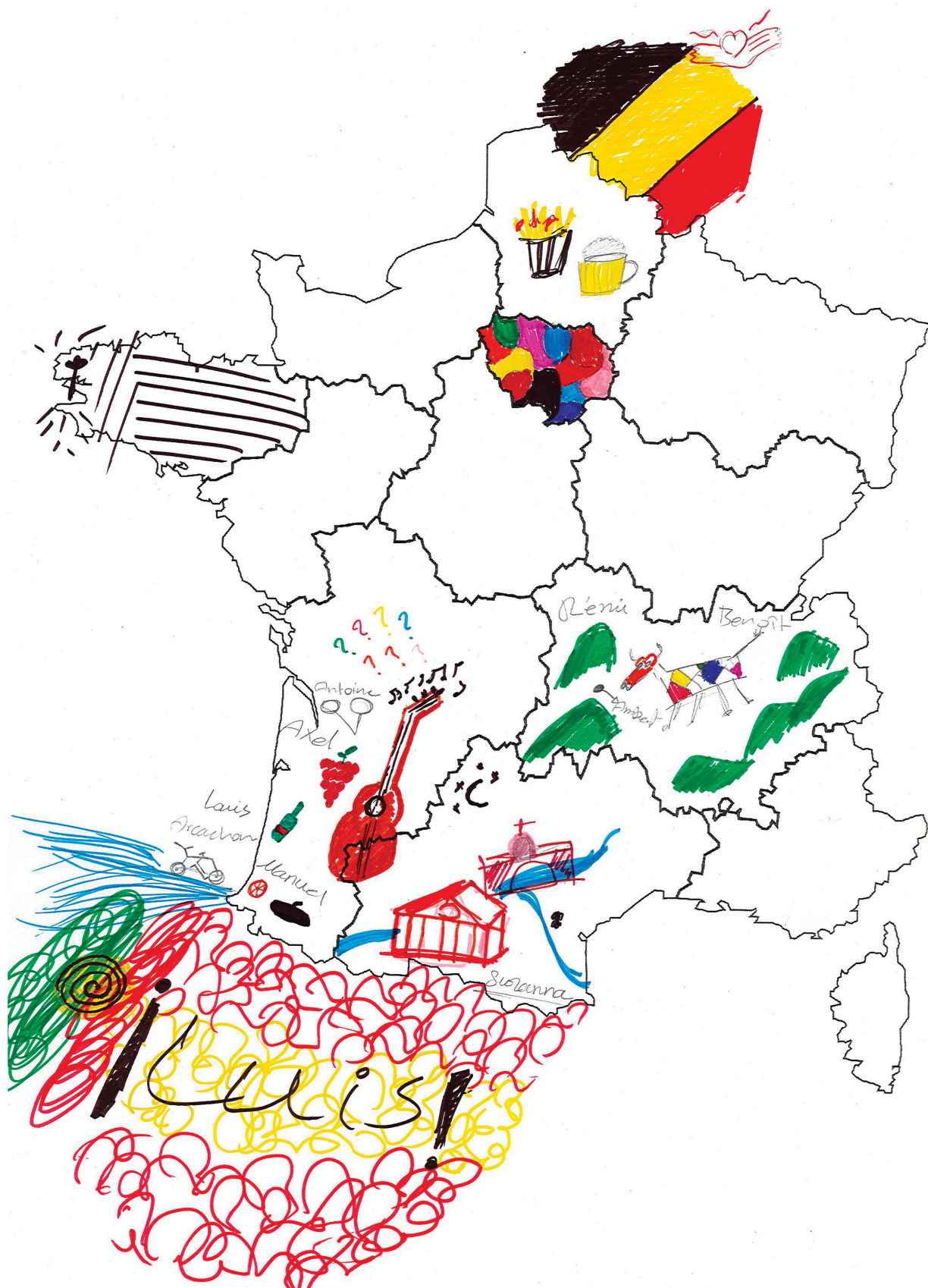
Figure 2. Carte sensible d'Ali, Atelier n°1, 26 mai 2021