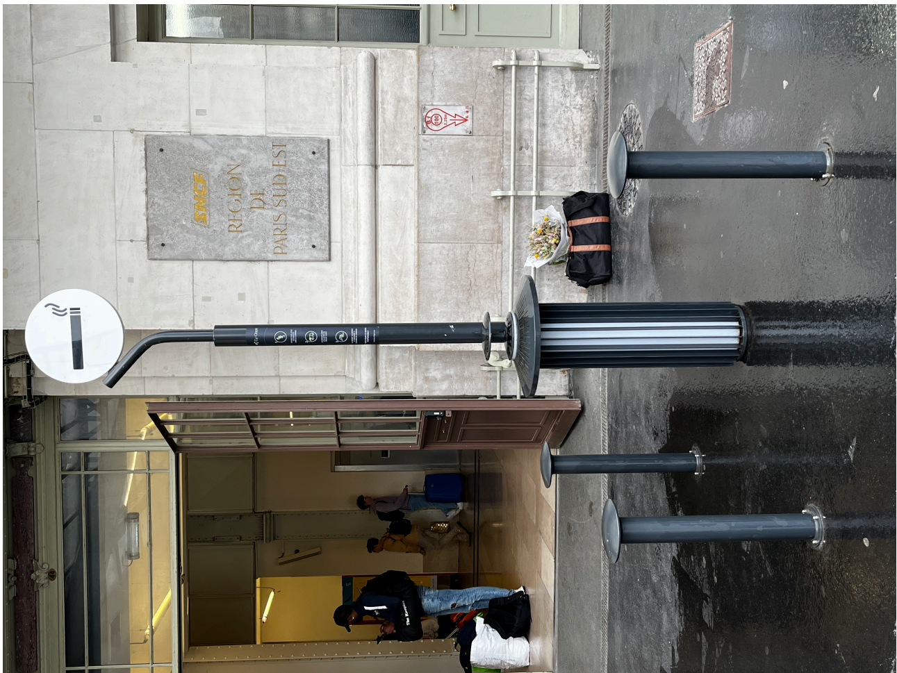
Figure 5. Sièges installés dans la zone fumeur à l'extérieur de la gare de Lyon à Paris.

Lors de mes observations, et pour avoir moi-même expérimenté ce mobilier, j'ai compris et assimilé la gestuelle et les attitudes d'usages, de même que les efforts que cette assise demande au corps pour être à peu près à l'aise. Déjà, un premier constat, ces tabourets sont très inconfortables (comme on peut s'en douter), ne permettant pas une assise prolongée (ce qui finalement correspond plutôt bien à la conduite liée à ce service). Toutefois, en plus de la taille extrêmement réduite de l'assise, le corps est toujours en tension et cherche en permanence l'équilibre à cause de sa forme légèrement arrondie. Pour cela, une seule solution, avoir le dos très droit, mais surtout avoir les jambes (très) écartées pour trouver une certaine stabilité. Et c'est là, justement, que je me suis rendu compte d'une différence très nette et marquée entre les personnes qui s'asseyaient : d'un côté, les personnes en pantalon et/ou avec des chaussures plates, d'un autre côté, les personnes en jupes et/ou avec des chaussures à talon, c'est-à-dire, dans la plupart des cas, des hommes assis et des femmes debout. Dès lors, soit on pense un mobilier fonctionnel et pratique pour toutes et tous sans distinction, soit on n'en propose pas : soit c'est pour toutes les personnes qui fument, soit ce n'est pour personne. La forme générale et le design particulier de l'objet ont des incidences et des conséquences importantes sur les pratiques, sur les usages et sur les individus en mesure d'en faire usage 19 .