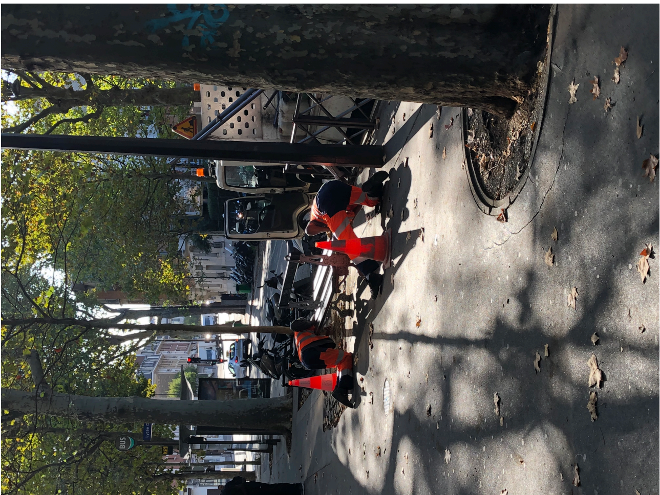
Figure 7. Suppression d'un banc public par des agents de la mairie de Paris.

En parallèle de mon doctorat, j'ai travaillé quatre ans comme AED – Assistant d'éducation – dans un lycée du 19 e arrondissement de Paris, à proximité de la situation précédemment décrite. Fin septembre 2019, des ouvriers de la Ville de Paris arrivent sur place et commencent à démonter ce banc. Un autre avait été enlevé quelques mois auparavant, à la fin de l'année scolaire précédente. On savait au lycée que celles et ceux qui habitent en face de l'établissement s'étaient déjà plaints plusieurs fois du bruit occasionné par la présence d'élèves la journée et de personnes la nuit : les cris, les rires, la musique étaient une source de nuisance sonore importante pour les riverains et les riveraines qui se sont réunies et sont allées rencontrer la mairie d'arrondissement pour demander à faire enlever ces bancs publics de la rue. Ils et elles ont eu gain de cause et ces deux bancs ont été supprimés de l'espace public.