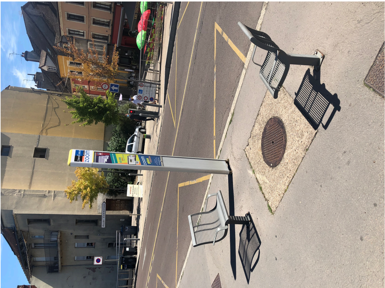
Figure 2. Assises pour attendre le bus à Chalon-sur-Saône.

françaises, munies d'un banc et d'un abri, ici, un choix différent a été fait, et pose plusieurs problèmes.