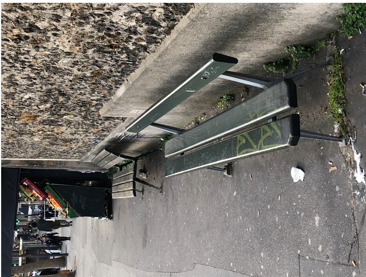
Figure 6. Deux bancs publics au design différent dans le 19 e arrondissement de Paris.

Cette dame m'expliquait que, depuis quelque temps, les bancs proposés dans l'espace public de Paris – en très grande majorité des bancs Davioud – ne sont plus adaptés ni à sa morphologie à cause de son âge ni aux usages qu'elle aimerait dorénavant en faire, qui ne sont plus exactement les mêmes qu'il y a 1, 3, 5 ou 10 ans. Cette dame me disait qu'elle aime sortir seule se balader, ce qui pour elle est un moyen important de garder une certaine liberté, mais surtout la preuve réelle de son autonomie : cependant son âge l'oblige à faire dorénavant des pauses régulières. Or, me disait-elle, il y a de moins en moins de bancs à Paris, l'obligeant à parcourir de plus grandes distances entre deux possibilités d'arrêts. Mais surtout la posture du corps, très droite, dictée par la forme des bancs et leur hauteur par rapport au sol l'empêchent d'en faire usage : elle m'a alors confié, très peinée, qu'elle préférerait continuer son chemin, et peiner, plutôt que de s'asseoir un instant, voire encore plus grave, ne pas sortir de chez elle, car elle savait déjà que cette sortie pourrait être compliquée. Ce qui m'a semblé important dans ce qu'elle me racontait, c'est qu'elle anticipe les difficultés d'accessibilité à la rue et à l'espace public, la peur liée à cela lui interdit parfois de sortir de chez elle.