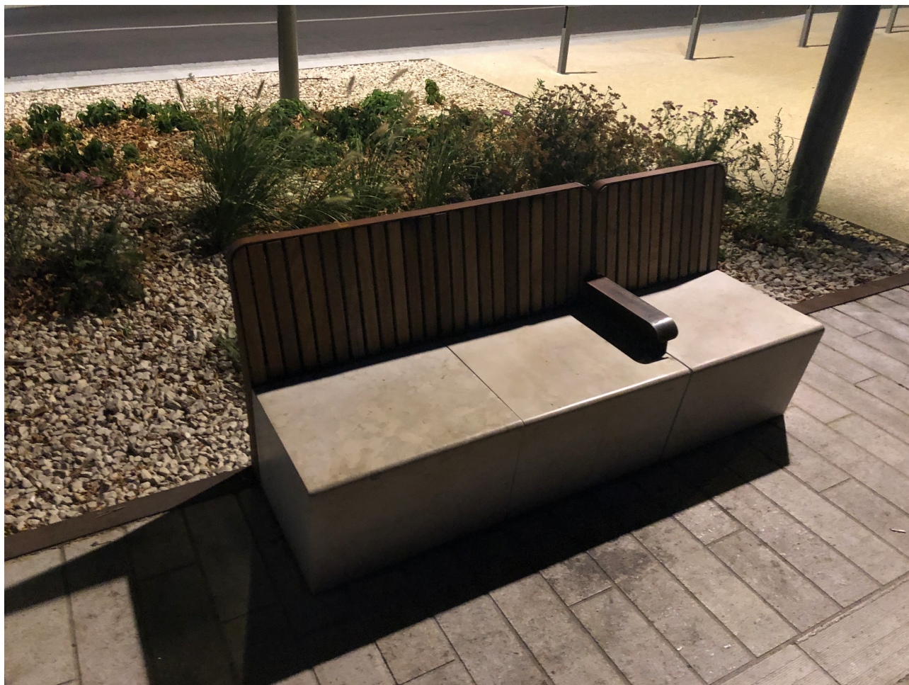
Figure 1. Banc public en pierre à Chalon-sur-Saône.

pour me raconter « son » histoire sur un banc public très précis de Chalon-sur-Saône (en Bourgogne), qui est aussi ma ville natale.