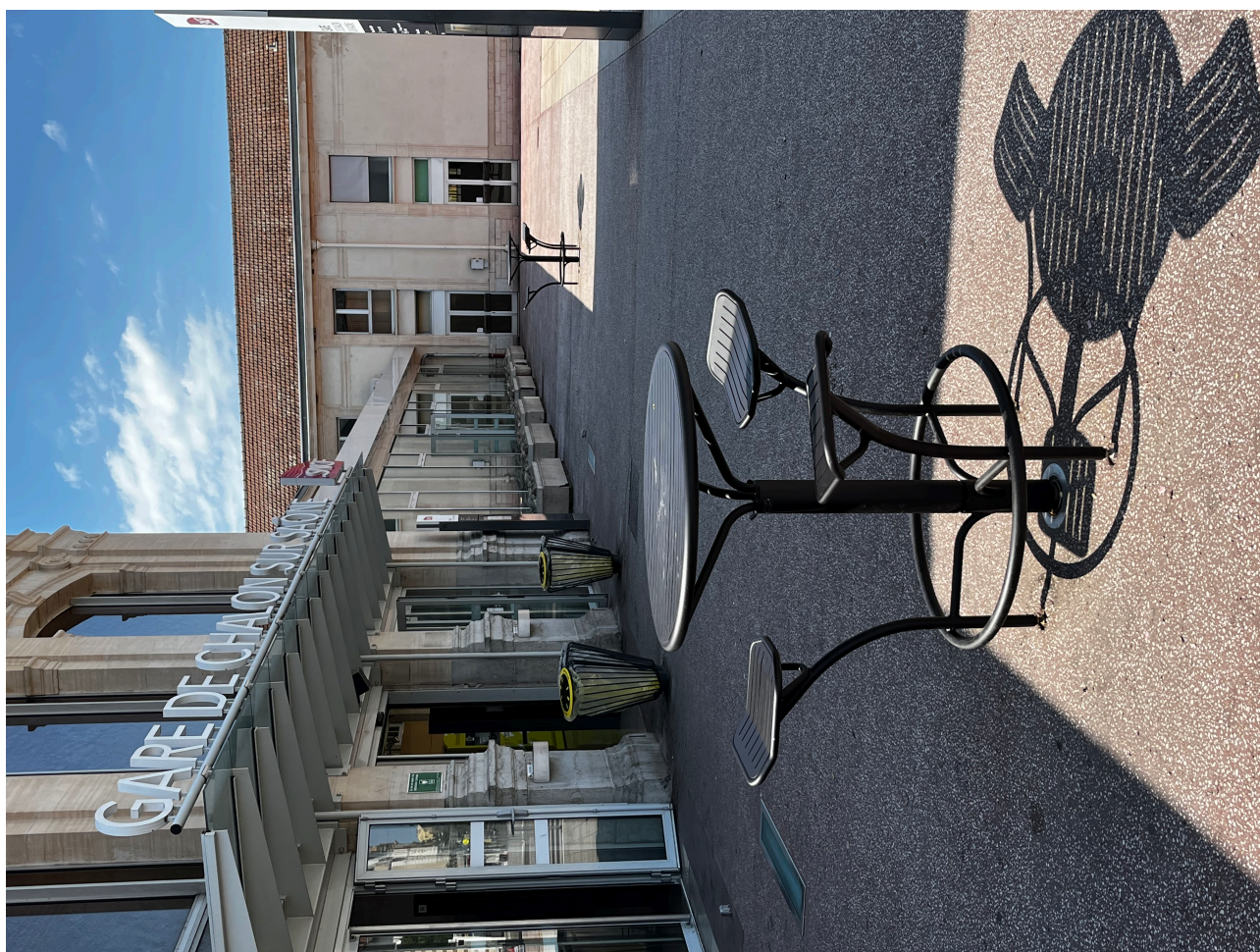
Figure 3. Assises sur le parvis de la gare à Chalon-sur-Saône.

de passage et de flux, mais aussi d'attente. La gare a une rythmologie particulière, car on y court autant qu'on y attend.