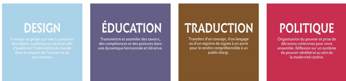
Figure 2. Cartes des catégories : « design, éducation, traduction et politique », jeu ABCDesign, Emilie HUC

En ce sens, chaque initiale a été pensée pour évoquer graphiquement son concept, sans tomber dans une illustration littérale. Elle se répète sur les deux cartes d'une même paire, mais avec une opacité réduite sur la carte de définition, pour offrir un indice visuel afin d'identifier les paires : la simple lecture du texte et interprétation graphique pouvant parfois être difficile. L'objectif n'étant pas de donner une illustration fermée du concept mais bien une évocation graphique et poétique, laissant aux joueurs une liberté d'interprétation. De plus, les concepts jalonnant la théorie critique du design étant au nombre de 39, ils ont été classifiés en 9 catégories distinctes — design, éducation, épistémologie, éthique, monde, politique, projet, reconnaissance et traduction — qui sont elles-mêmes devenues des cartes à part entière. Ces dernières fonctionnent alors de manière individuelle, elles évoquent la catégorie et sa définition. Notre jeu comportant 3 versions, elles viennent alors servir une manière spécifique de jouer.