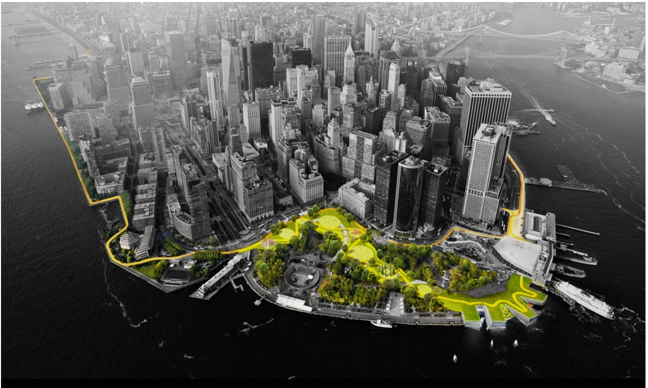
Figure 5. The Dry Line New York, 11/2017

Comme beaucoup d'autres villes côtières dans le monde, la ville de New York est confrontée à un risque élevé d'inondations, en particulier lors de phénomènes météorologiques extrêmes, comme l'ont montré les ouragans Irene en 2011 et Sandy en 2012. Comme il est prévu que ces événements continuent à se produire à l'avenir, la ville a élaboré un guide de design urbain pour la résilience climatique. Il traite des risques d'inondation croissants dans la ville de New York et améliore sa durabilité face à l'élévation du niveau de la mer, aux précipitations extrêmes et à la chaleur extrême 32 .