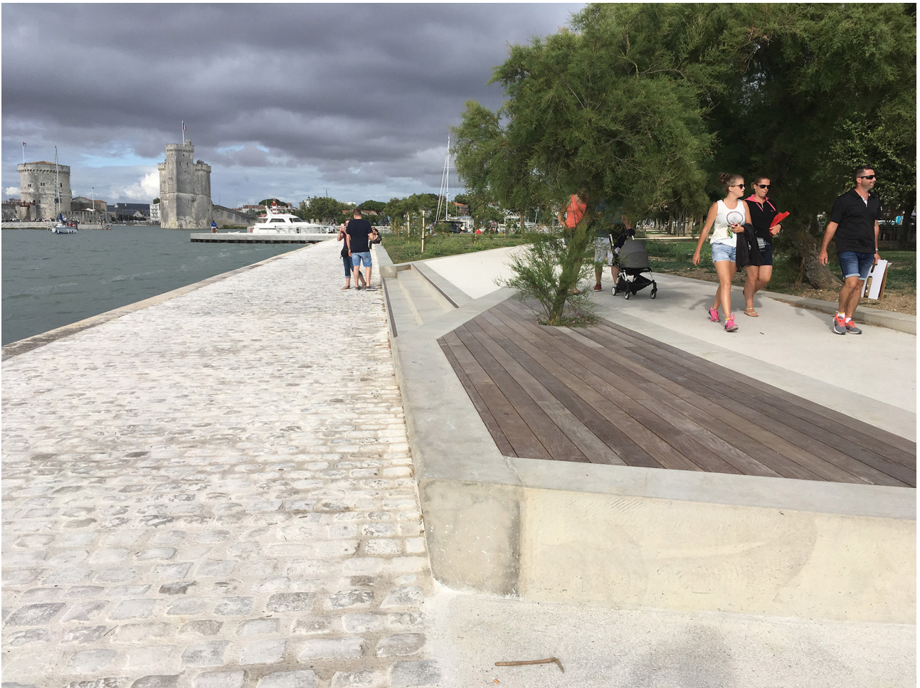
Figure 4. PAPI Gabut La Rochelle. Programme d'Actions de Prévention contre les Inondations en site classé. Recomposition urbaine et intégration de dispositifs de réductions des risques inondations. 2024

Un projet respectueux du patrimoine qui n'est pas sans rappeler, même s'il a été développé à une tout autre échelle, l'aménagement des berges de Manhattan après le passage de la tempête Sandy. En guise de digue, le projet Dryline 31 ("ligne sèche", ou "Big U") imaginé par l'architecte danois Bjarke Ingels, propose de créer une barrière verte sur les rivages de l'île : pistes cyclables en hauteur, parcs en espaliers, plantation d'arbres supportant l'eau salée.