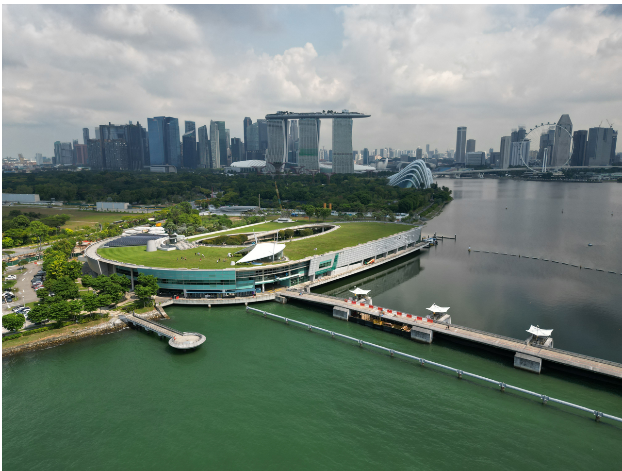
Figure 2. Marina Bay Barrage CloseUp, Singapour 2024, Crédits Bob Tan.

Quant à la barrière anti-crues et anti-marées construite à travers l'embouchure du canal à Singapour, elle a transformé les eaux du bassin en un réservoir intérieur. La baie Marina présente aujourd'hui un niveau d'eau stabilisé, sans fluctuations de marées.