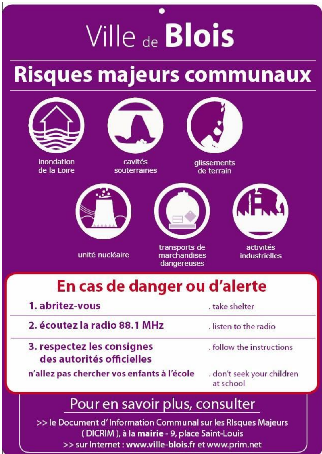
Figure 3. Comparaison de pictogrammes