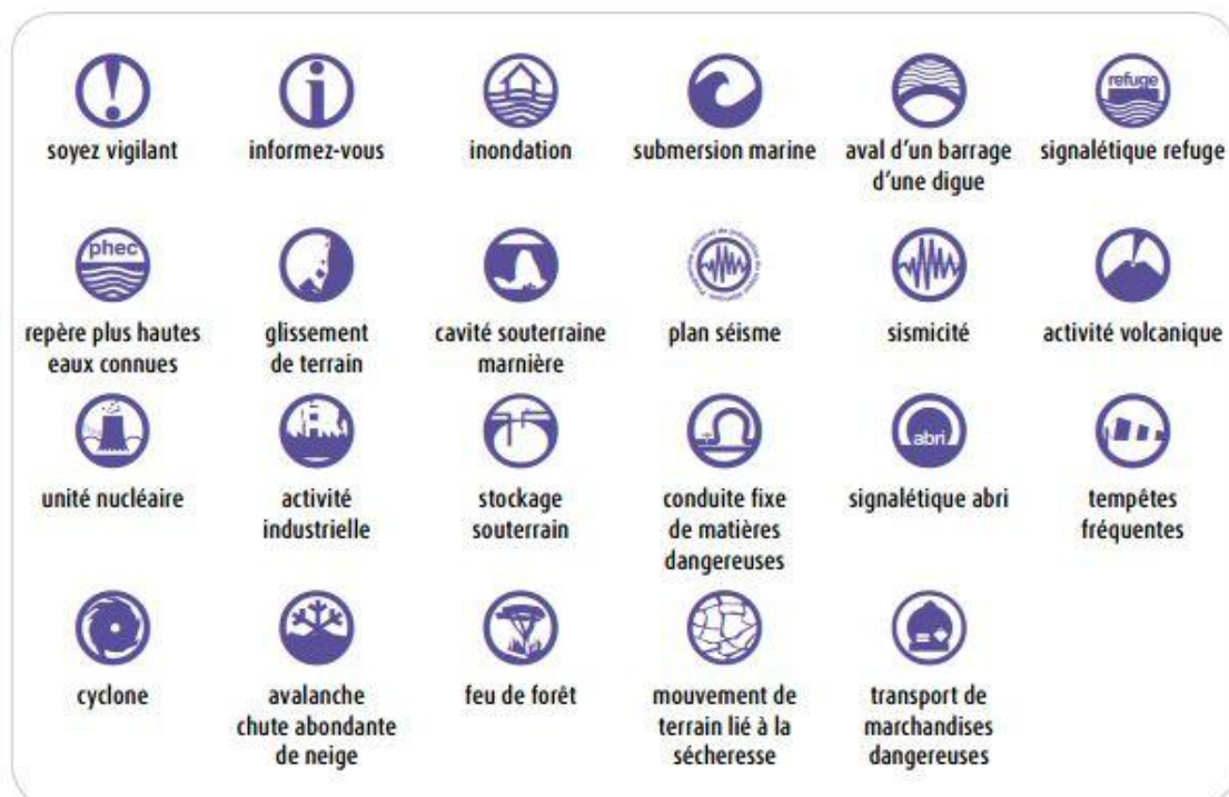
Figure 1 : Extrait d'une cartographie d'un quartier de Nîmes précisant l'exposition au risque retrait-gonflement des argiles (2022).

L'énonciation du « retrait-gonflement des sols argileux » en tant que menace à la fois locale et majeure est faite sur le site internet Géorisques du Ministère de la Transition Écologique et Solidaire (MTES) 26 . Les cartes précisent l'exposition au RGA à l'échelle de la commune selon quatre niveaux : pas d'information disponible, exposition faible, moyenne ou forte. Or les cartes sont statiques et ne permettent pas de mesurer une évolution du risque dans le temps pas plus qu'elles ne renseignent sur la sinistralité. Sans revenir sur une histoire de la cartographie, il importe de souligner à quel point les cartes ne constituent pas une représentation univoque des espaces et des informations s'y rapportant 27 . Si la cartographie transforme l'invisible en visible 28 , il faut comprendre ce qui a été mis en premier plan et ce qui demeure dans l'ombre. Ainsi les contours des zones représentées ne permettent pas de déterminer précisément à l'échelle de la parcelle quels sont les bâtiments potentiellement concernés (Figure.1). En termes d'énonciation du risque à partir d'éléments visuels et formels, la représentation graphique imprécise est figée. Au regard des personnes concernées, elle ne permet ni de visualiser les mouvements en devenir, ni de se saisir d'une information engendrant une vigilance face au RGA.