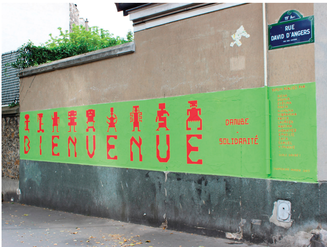
Figure 1. Une fresque d'accueil dans le quartier. Réalisée à partir des ateliers avec des habitants, Fabrication-Maison.

La résidence Danube-Solidarité du collectif Fabrication-Maison peut également assez bien illustrer une écologie sociale propre au design graphique. Le collectif est une association installée dans le quartier Danube-Solidarité. À l'occasion d'ateliers ils invitent les habitants à concevoir la signalétique et la communication des événements de quartier.