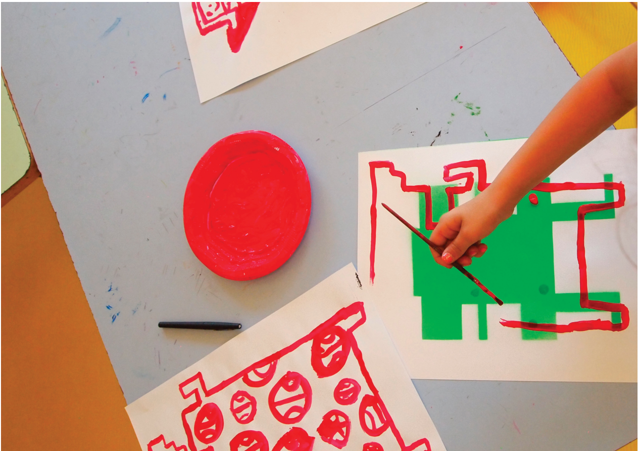
Figure 2. Phase de conception du projet Danube-Solidarité, Fabrication-Maison.