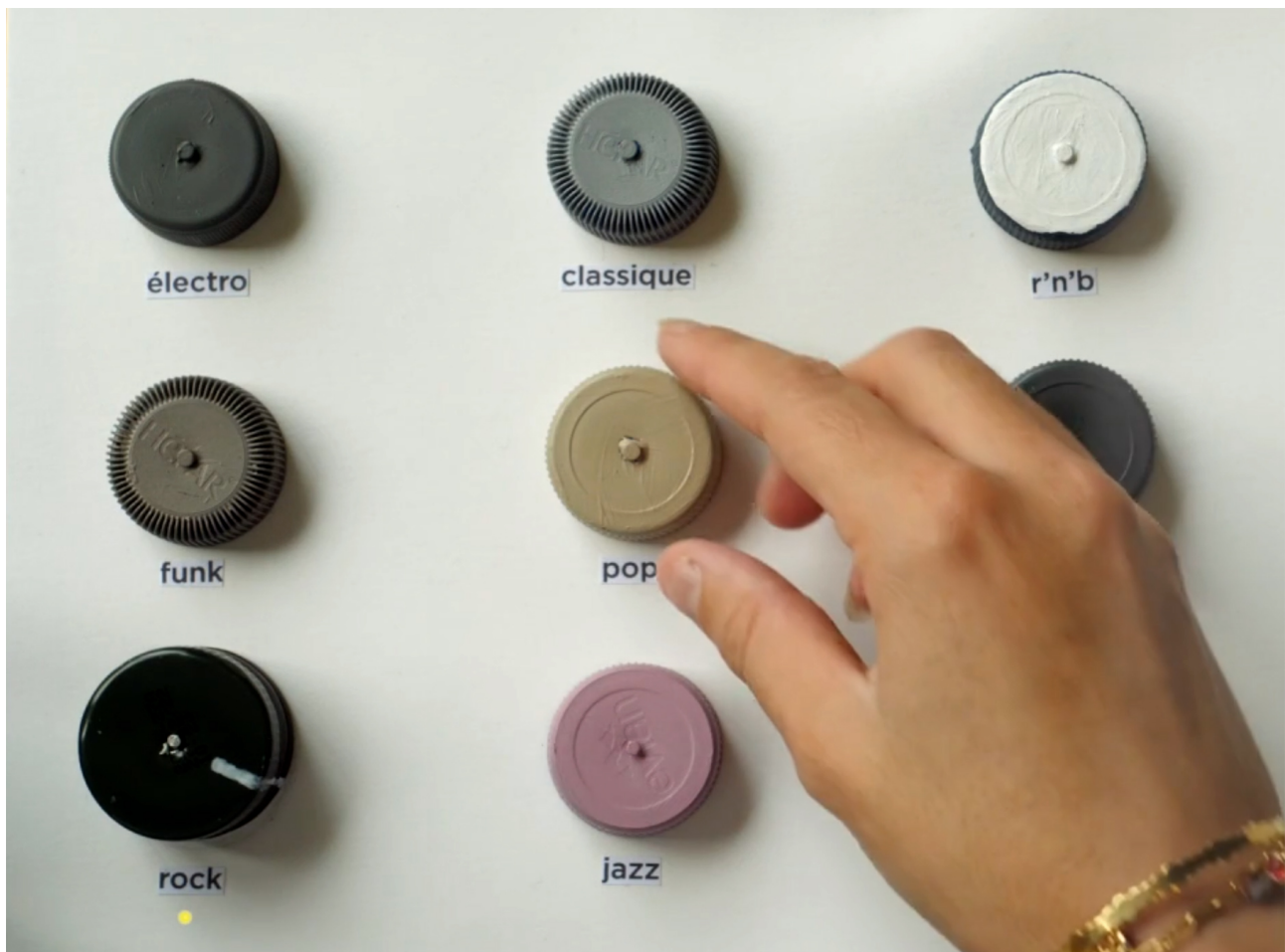
Fig. 5 : Projet Streamix , par Claire-Marie Bachelez, Victoire Bruna, Jeannette Guerin, Anissa Sahli, 2020 84 .

Avec Shakesong 85 , des vibreurs et des potentiomètres sont utilisés conjointement afin de fabriquer une enceinte vibrante. En tournant les sections de l'objet, les différentes pistes d'un morceau peuvent être jouées plus ou moins fort, offrant la possibilité de comprendre les composantes instrumentales dans une dimension tactile et sensible.