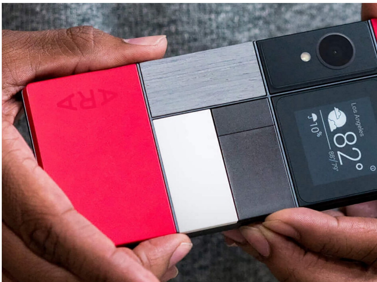
Fig. 2 : Projet ARA, Google ATAP, 2016 66 .

Dans le design numérique, des smartphones minimaux ont vu le jour, et constituent des propositions alternatives aux modes de production et de consommation hégémoniques au sens de la théorie gramscienne 61 . Par exemple, ils proposent d'alléger la charge cognitive, par des graphismes minimaux et des fonctions réduites, comme dans les interfaces de Lightphone 62 et de Mudita Pure 63 , affichées en bichromie via des écrans e-ink. Cette sobriété doit permettre à l'utilisateur de se concentrer sur l'essentiel, de ne pas gaspiller son attention – une promesse clarifiée par Mudita sur son site : Minimalistic design for simple living . Dans d'autres cas, comme ceux du Fairphone 64 ou du Projet ARA 65 , leur conception technique et leur modularité les rendent réparables et augmentables facilement, en interchangeant des blocs fonctionnels plutôt que de remplacer l'objet entier – l'autonomie de l'utilisateur dans ce processus étant visée. Cette conception de la réparabilité induit des spécificités formelles qui ne sont cependant pas considérées de façon égale : d'un côté, le fait d'avoir des blocs fonctionnels séparés est accentué par la coque transparente du Fairphone 3, et forme un jeu graphique emblématique pour le Projet ARA. D'un autre côté, les volumes plus importants à gérer sont considérés comme un inconfort – les concepteurs visant un encombrement similaire à celui d'un smartphone classique.