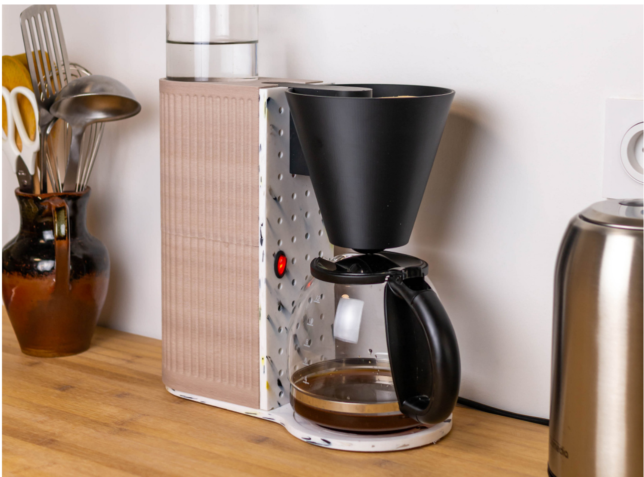
Fig. 3 : Cafetière, Désirer ce qui est jeté , Agence Entreaute, 2020 71 .

Trois projets de designers français nous semblent pertinents à mettre en perspective autour de la réutilisation de DEEE pour créer de nouveaux objets. La cafetière conçue en 2020 par les designers de l'agence Entreaute 67 , en collaboration avec Bold 68 et le 8Fablab 69 , est un objet manifeste d'une exploration plus large visant à valoriser les objets jetés, considérés obsolètes bien que la plupart des éléments qu'ils contiennent fonctionnent encore. Les designers s'attachent à la réutilisation de ces éléments, initialement destinés au recyclage. Avec l'hétérogénéité de ces composants, un langage formel se développe, basé sur une architecture produit modulaire et évolutive. Les solutions trouvées sont envisagées à l'échelle locale et de manière à pouvoir être répliquées : la fabrication additive et la découpe de plaques de plastique recyclé composent les parties structurantes et la coque. La production pourrait ainsi s'appuyer sur la Fab Unit 70 ( http://www.fabunit.fr/ ) un atelier de fabrication de petites séries principalement destiné au local et basé sur un modèle d'économie circulaire, auquel l'agence est associée.