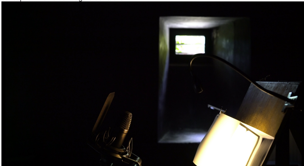
Atelier studio d'enregistrement, Gaillard d'arrière, Martel, espace de lecture et d'enregistrement de Moby-Dick , mai 2017.

Cet article propose un chassé-croisé entre une observation des caractéristiques essentielles de la figure du Pequod, des éléments de définition génériques de l'atelier et des cas d'exemples précis qui résultent des activités du programme de recherche Moby-Dick. Nous tenterons d'observer comment la mobilité, inhérente au roman de Melville, à notre programme et à notre monde contemporain, infléchit les modalités du faire (de l'art et de la recherche) et transforment la conception même de la figure de l'atelier.