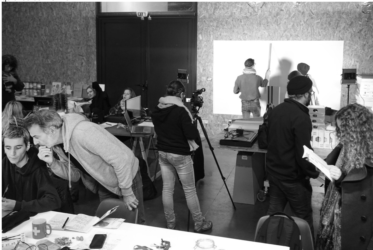
Résidence Le radeau , Centre d'art Le Bel Ordinaire, Pau, décembre 2018

Autre lieu commun, à ces trois temps (avant, pendant, après) et à cette double dimension de l'entretien (manuelle et verbale) s'ajoutent et s'entrecroisent plusieurs modes opératoires. L'atelier est le lieu où se déploient des savoirs et des savoir-faire particuliers. L'atelier est donc d'abord le lieu de la réalisation, de la maîtrise des gestes et des actions 21 , même si ces activités sont conduites parfois avec beaucoup de bricolage et de bon sens, à l'image de ce qui se déploie sur le Pequod. Mais c'est aussi le lieu de l'apprentissage ; c'est encore celui de l'observation et de l'expérimentation, de la recherche, de l'invention, du test, de l'échec et de la réussite, de la prise de risque et de l'imagination 22 . L'atelier doit donc aussi être le lieu du doute, de la mise en danger, de la spécialisation, mais aussi de la polyvalence et de la réactivité. Enfin, dernier mode opératoire, l'atelier est le lieu du rangement physique et mental. C'est l'espace où se mettent en ordre les idées et les formes, où se classent et s'analysent les réalisations et les connaissances qu'elles contiennent.