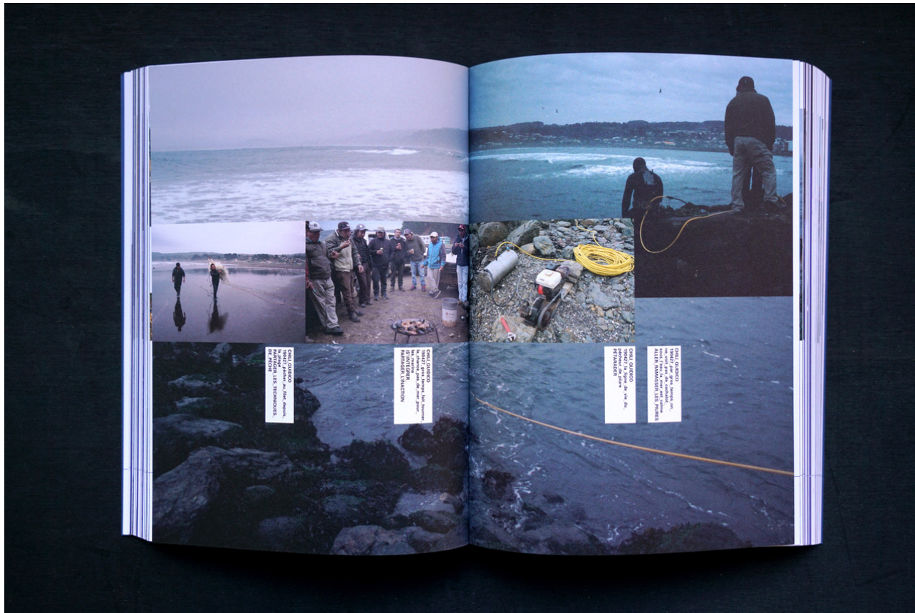
Le livre atelier, Sillage Melville , Bordeaux, 2020, p. 160-161.

Espaces numériques et ouvrages imprimés représentent la dernière forme appareillée de l'atelier mobile.