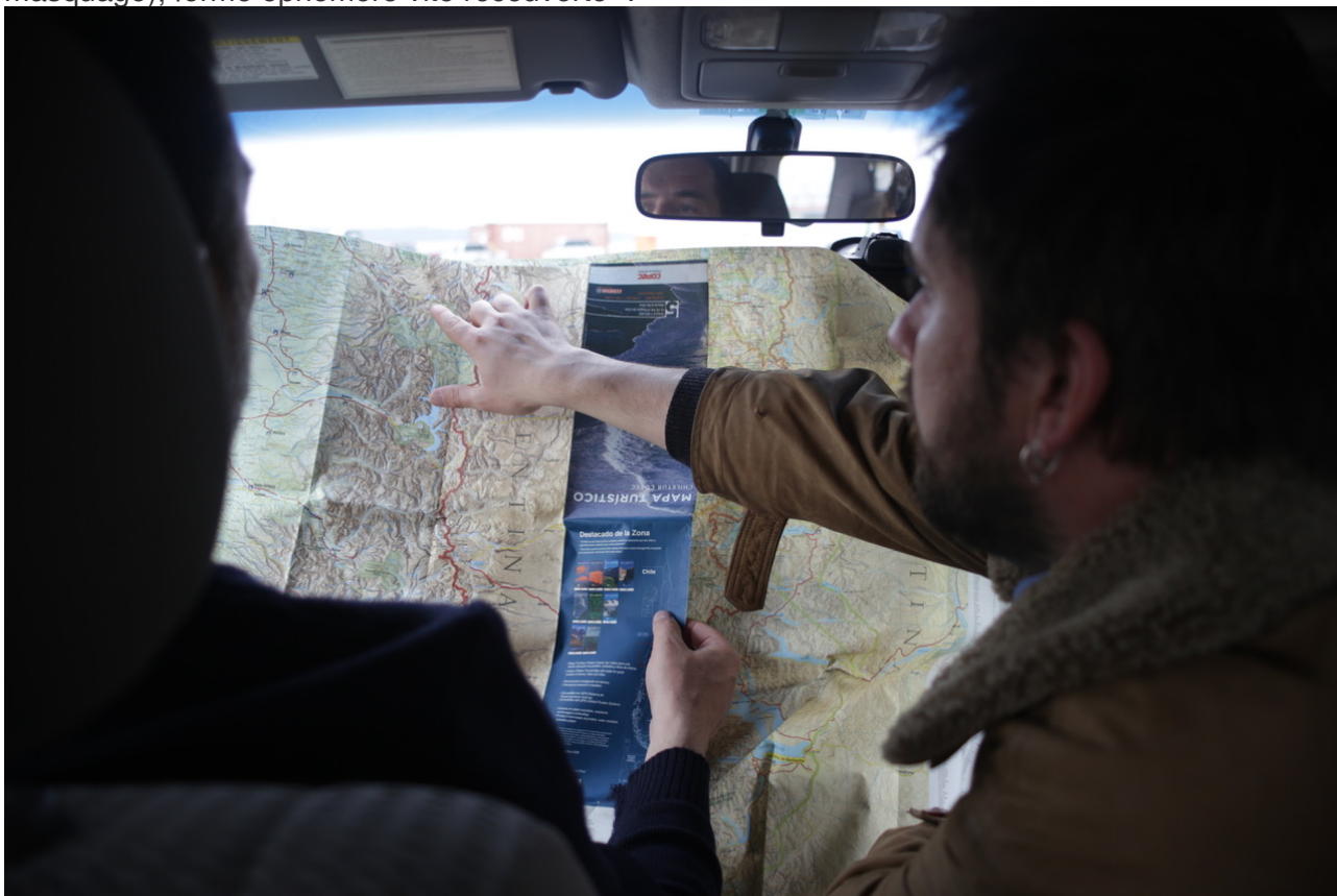
Le Toyota, sur la route, Chili, avril 2019