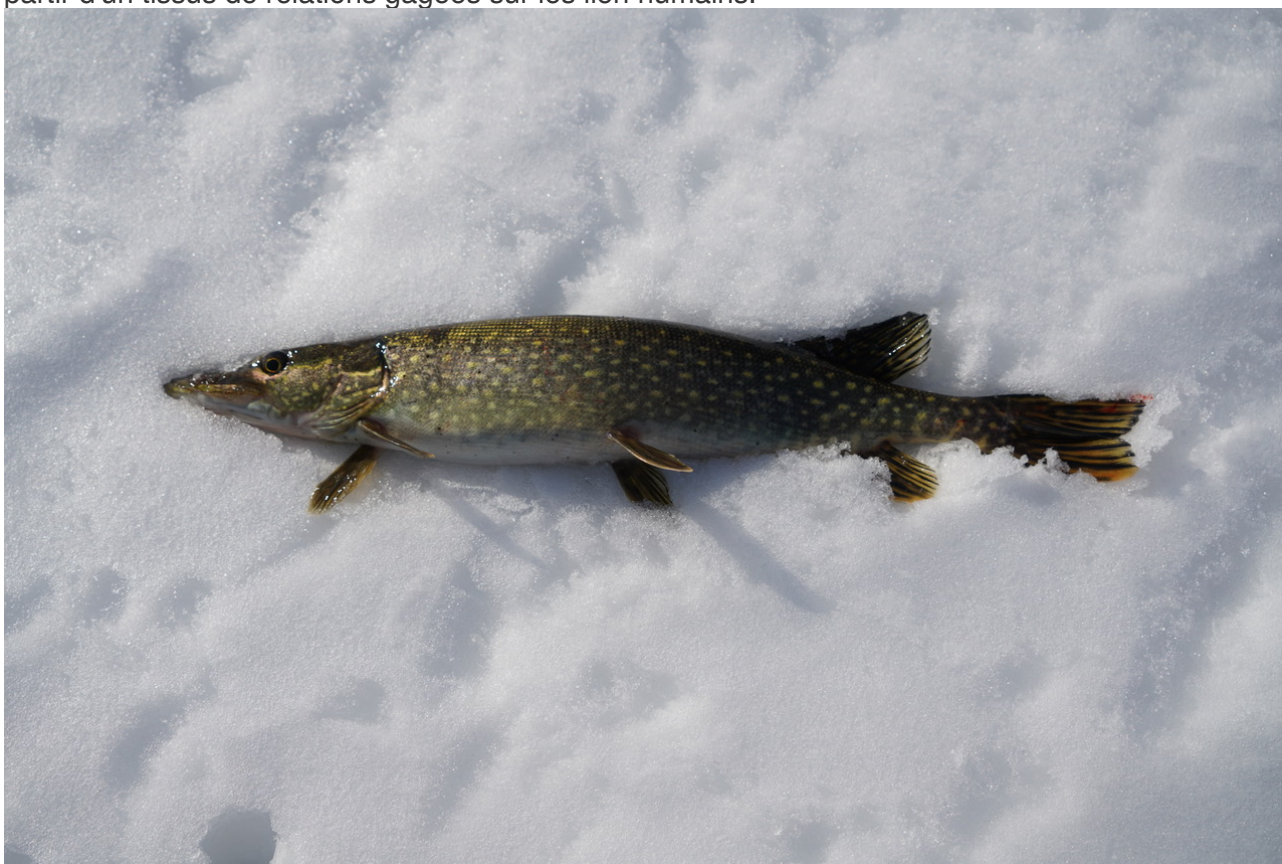
La constitution algonquine dans la tête du brochet, Kitgan Zibi, février 2020.

partir d'un tissu de relations gagées sur les lien humains.