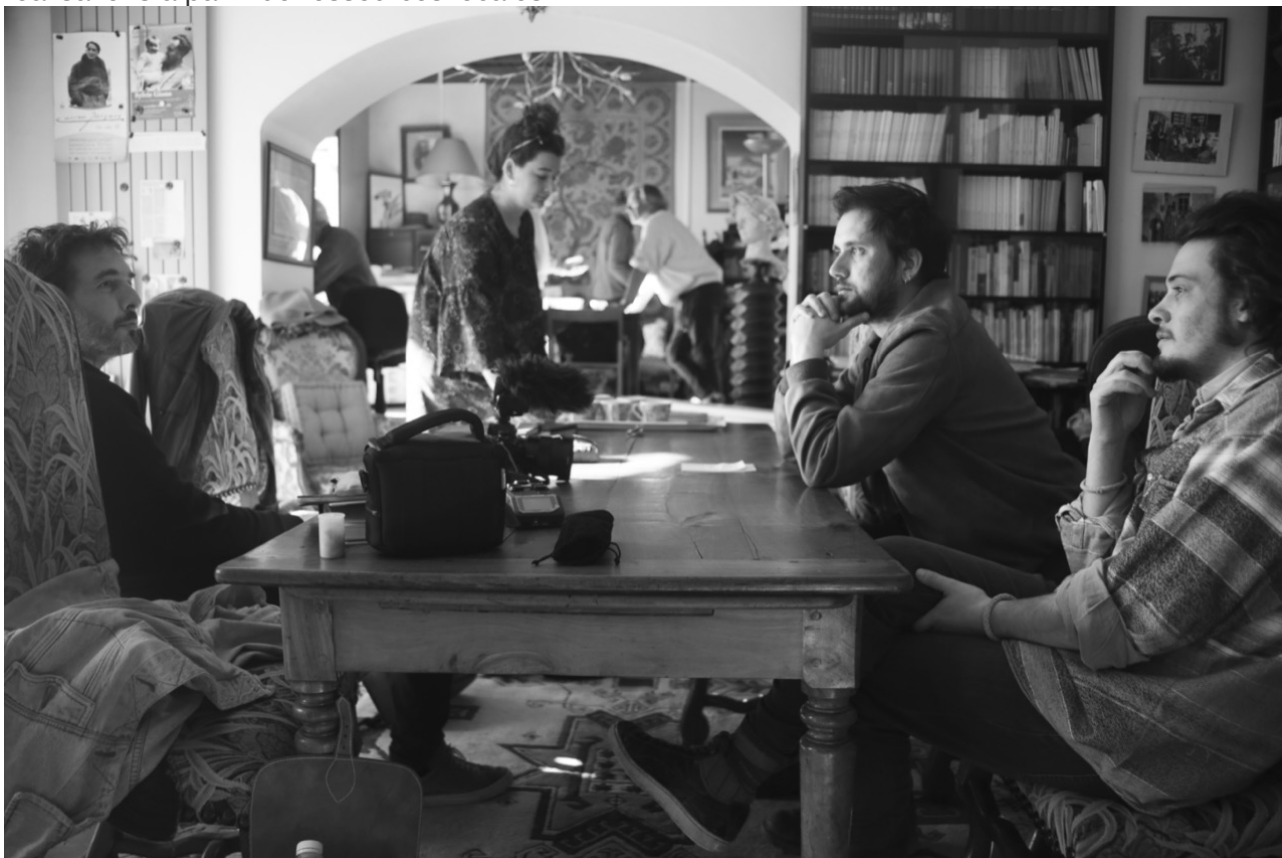
Résidence Centre Jean Giono, Le Paradis, Manosque, photo Chloé Bappel 26 mars 2019.

expérimenter entre 2017 et 2021. Puisqu'empiriques, ils ont certainement tous quelque chose d'imparfait. Les principes qui s'en dégagent résultent donc, certes de quelques modèles théoriques utiles en bien des points 25 , mais tout autant de l'expérience. Nous l'avons déjà dit, certains ateliers sont investis de manière durable à l'image du labo D08 du Laboratoire des objets libres à l'université Bordeaux Montaigne, d'autres le furent de manière très éphémère, comme une chambre d'hôtel, une voiture ou un volcan. L'extrême mobilité et la frugalité de bon nombre de situations infléchissent toujours, d'abord l'ensemble du matériel que l'on emporte, ensuite la nature même des pratiques qu'on développe. Compte tenu du fait que le principe fondamental est de ne rien laisser sur le lieu investi qui ne soit préjudiciable à la localité, naturellement la logique de production s'est intuitivement déplacée vers des activités à faible impact, à l'image de pratiques photographiques, vidéographiques, verbales, performatives, graphiques, services rendus, ou réalisations à partir de ressources locales.