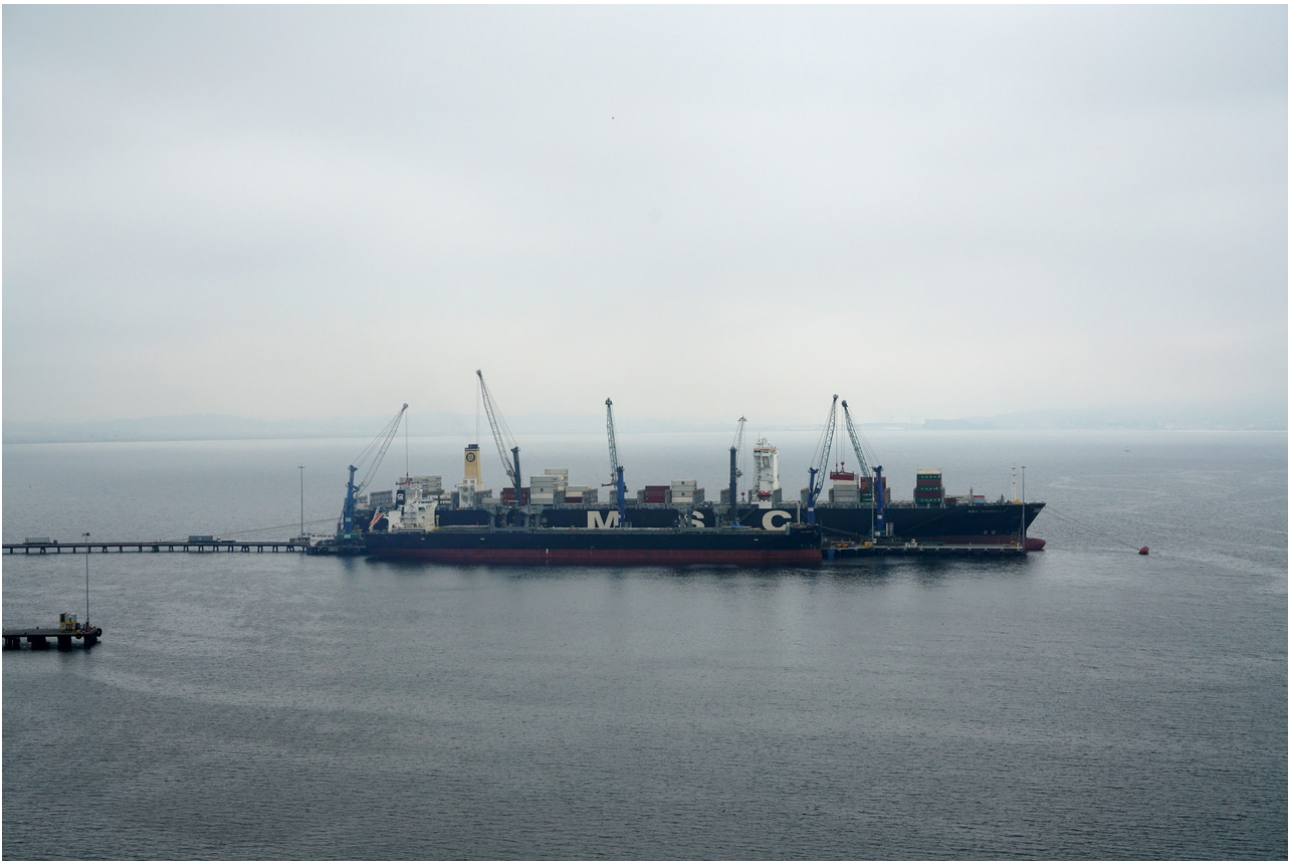
Porte container, Concepcion (Lirquen), Chili, avril 2019.