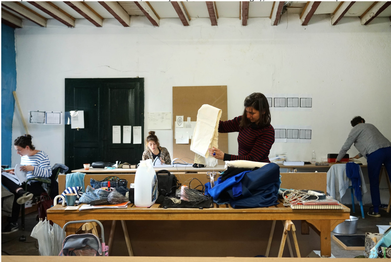
Atelier, Gaillard d'avant, espace pratique d'interprétation des chapitres de Moby-Dick, mai 2017.

autour d'un lien commun qu'est le travail 18 . De surcroît, tout atelier a son organisation ou au moins un ensemble de repères, qui permettent aux activités de se déployer, de trouver leur équilibre et, si possible, d'être capables de durer a minima . Un atelier est donc une entité organique qui croise ces quatre facteurs que sont le lieu, les objets (au sens très large), les actions et les personnes 19 .