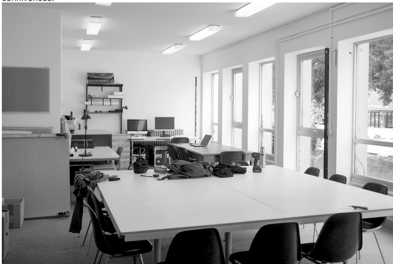
Le petit labo à la Maison des Sciences de l'Homme et d'Aquitaine (MSHA), Université Bordeaux Montaigne, Pessac, juin 2021.

Il va de soi enfin, que si l'univers universitaire est un formidable outil qui permet de développer librement ses idées (quoi qu'on en dise c'est tout de même son trait principal), il est aussi, si je puis dire, « aqueux », hostile. Il entretient les rapports de pouvoir par la fragmentation, les clivages et les rivalités. La raison économique épuise les considérations bienveillantes 51 . À l'image de Virginia Woolf qui prônait, contre l'emprise masculine, d'avoir « une chambre à soi 52 », le fait d'avoir dans l'enceinte de l'université un « espace à soi » permet non seulement de préserver son espace de pensée, plus encore d'y accueillir librement une communauté avec qui partager ses connivences.